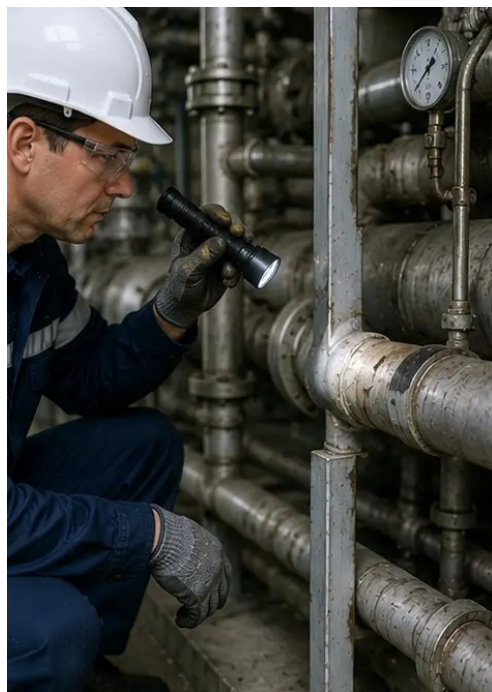
照片 №9. 按保养计划完成管道检查