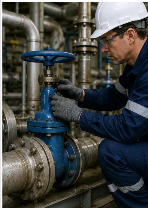
照片 №10. 检查期间评估的阀门状况