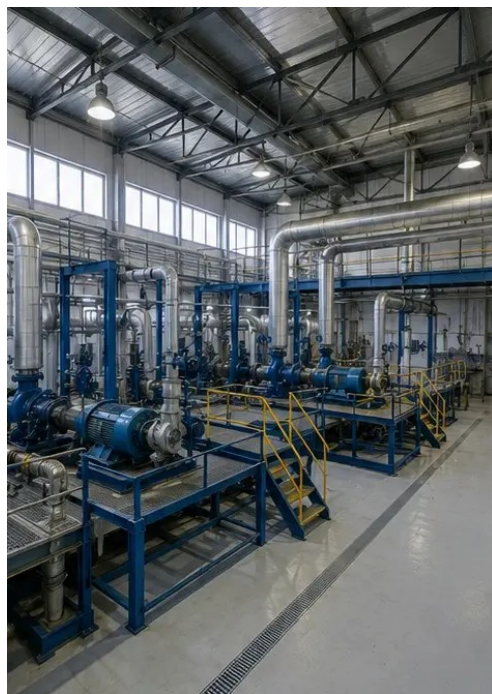
照片 №1. 工业设施总体概览