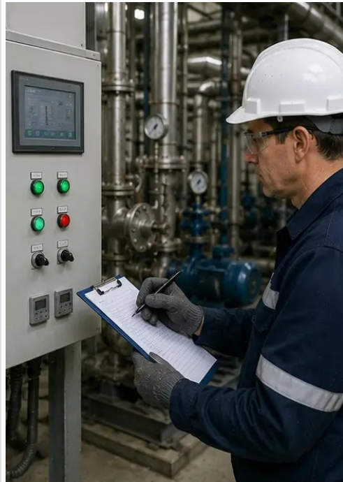
照片 №14. 已进行最终保养验证