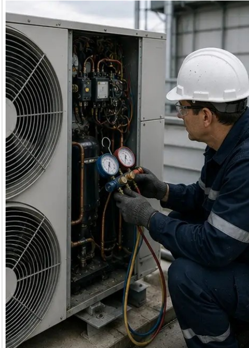
照片 №6. 暖通空调设备状况已记录