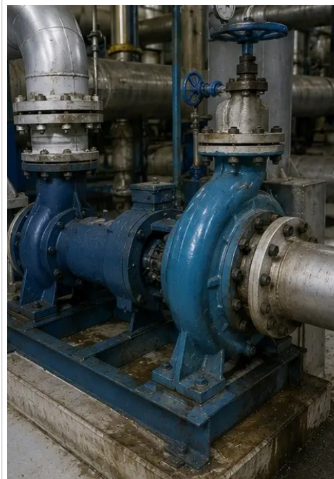
照片 №3. 保养期间评估的工业泵状况