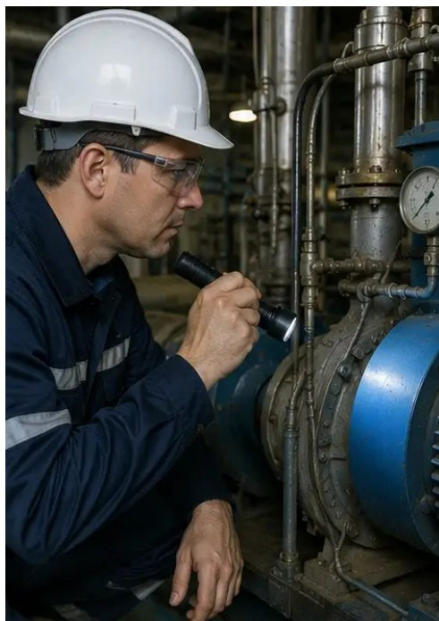
照片 №2. 机械设备检查完成