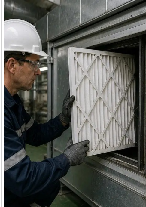
照片 №7. 空气过滤器更换完成