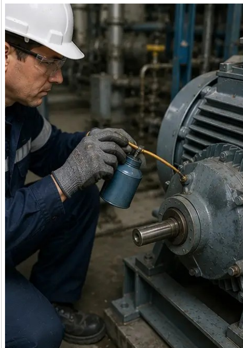
照片 №11. 对设备零部件进行了润滑作业