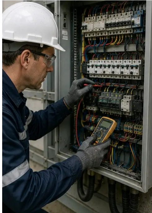
照片 №5. 已进行电气柜检查