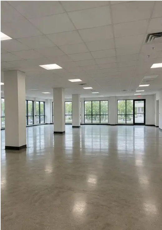
照片 №16 被检物业的最终概览