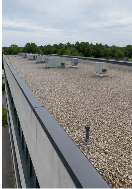
照片 №5 屋顶状况检查完成