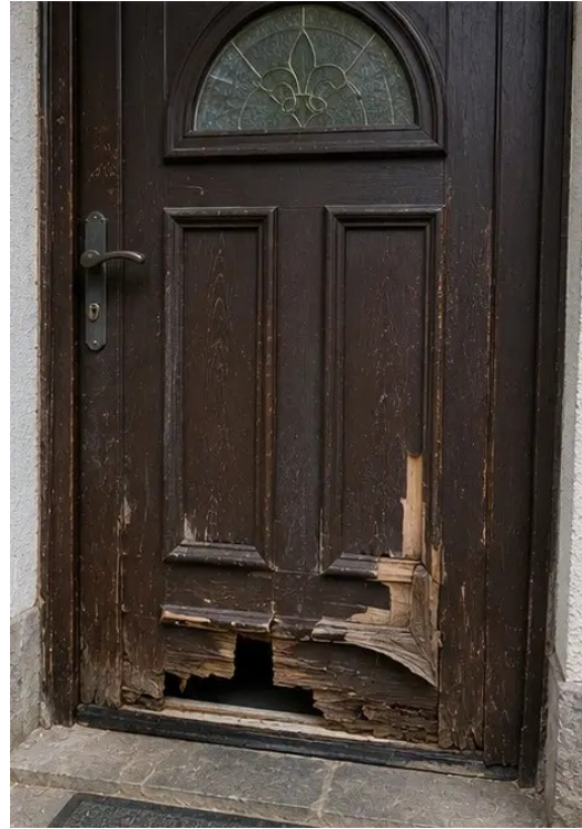
Ảnh số8 Cửa ra vào hư hỏng được ghi nhận trong quá trình kiểm tra