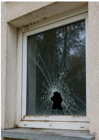
Photo #8. Cửa ra vào hư hỏng được ghi nhận trong quá trình kiểm tra

Photo #7. Cửa sổ hư hỏng được ghi nhận để đánh giá