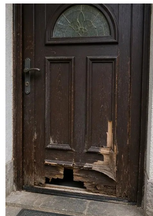
Photo #8. Cửa ra vào hư hỏng được ghi nhận trong quá trình kiểm tra