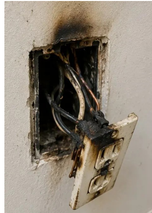
Photo #12. Hư hỏng hệ thống điện được ghi nhận trong quá trình kiểm tra