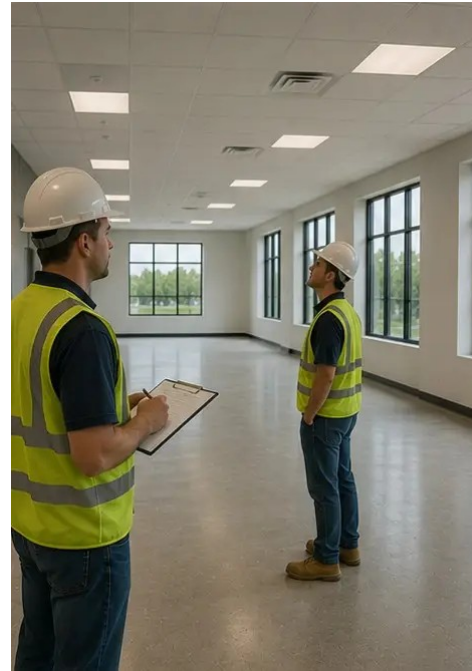
Ảnh số15. Đã tiến hành kiểm tra dự án lần cuối