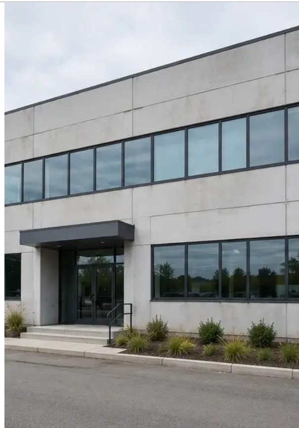
Ảnh số2 Tình trạng mặt tiền phía trước trong quá trình kiểm tra