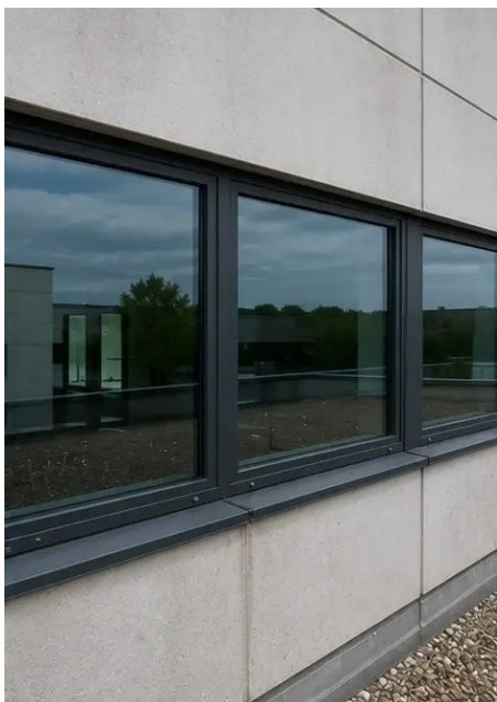
Photo #6. Tình trạng cửa sổ được ghi nhận trong quá trình kiểm tra