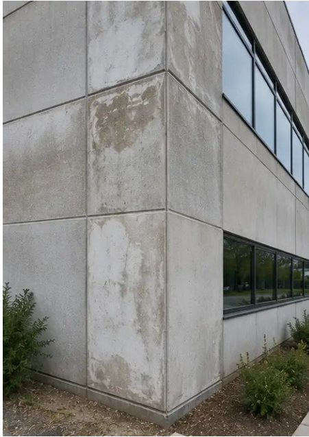
Photo #4. Tình trạng tường ngoài được ghi nhận trong quá trình kiểm tra