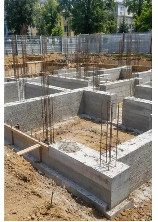
تصویر 3نہ فاؤنڈیشن کی تعمیر جاری ہے