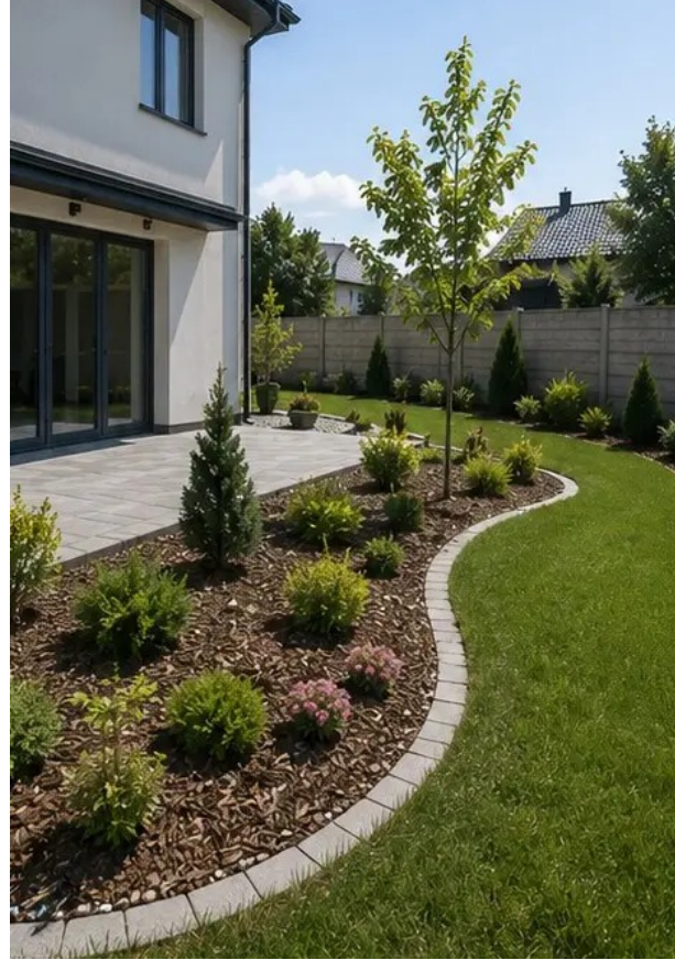
تصویر 14ء سہولت کے ارد گرد بیرونی لینڈ اسکیننگ مکمل