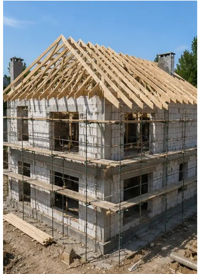
تصویر 8ء چھت کی تنصیب کا کام مکمل

کے ساتھ بنایا گیا - آن لائن فوٹو رپورٹ جنریٹر Photo Reports