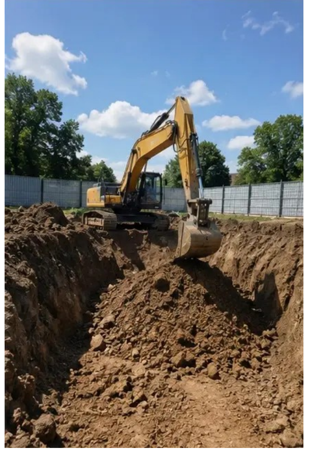
تصویر 2# منصوبے کی ضروریات کے مطابق کھدائی کا کام انجام دیا گیا