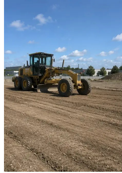
تصویر 3N. زمین کی صفائی اور ہمواری مکمل