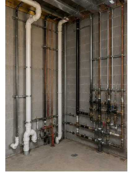
تصویر 12N. پلمبنگ سسٹمز کی تنصیب مکمل