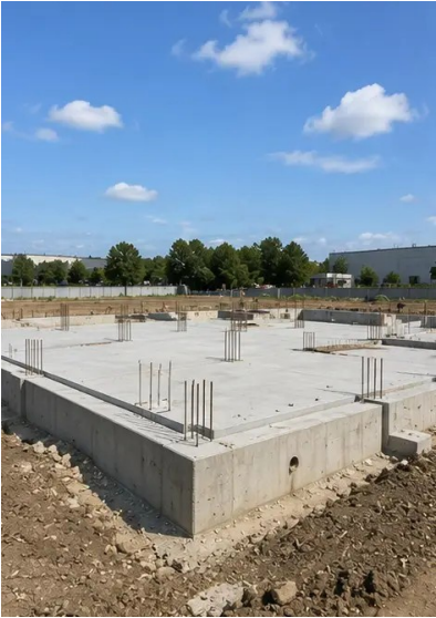
تصویر 5N. فاؤنڈیشن کی تعمیر مکمل