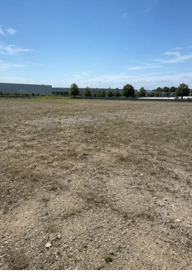
تصویر 1N. کام شروع ہونے سے پہلے منصوبے کی جگہ