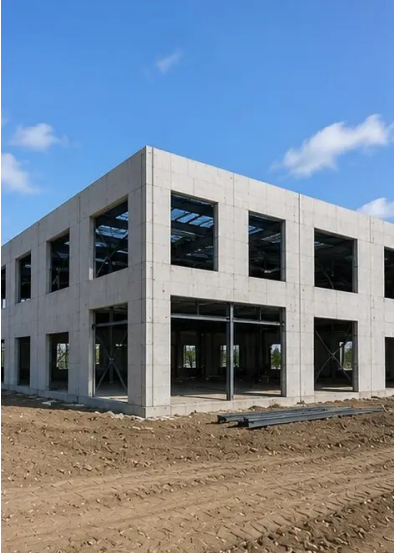
تصویر 9N. Structural frame completed according to project schedule