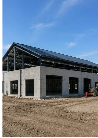
تصویر 10N. چھت کی تعمیر مکمل