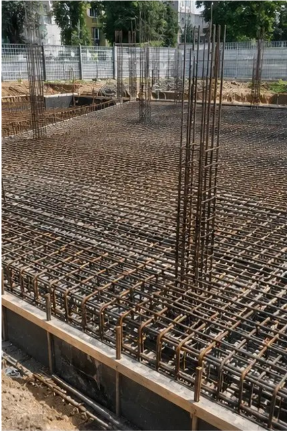
รูปภาพ №4 ติดตั้งเหล็กเสริมเสร็จก่อนเทคอนกรีต