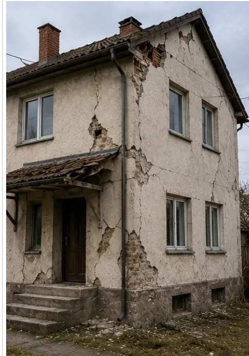
Fotografi nr15 Översikt över flera skadeplatser