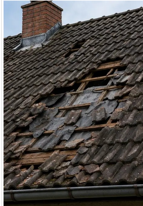
Fotografi nr3 Skadat takområde identifierat och registrerat