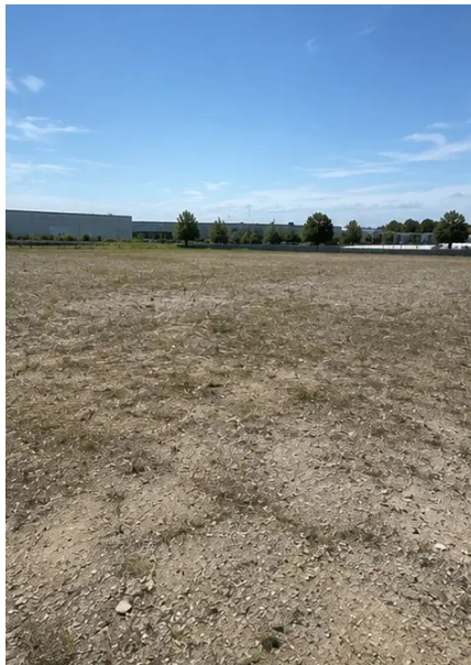
Fotografi nr1. Projektplats före arbetets påbörjande