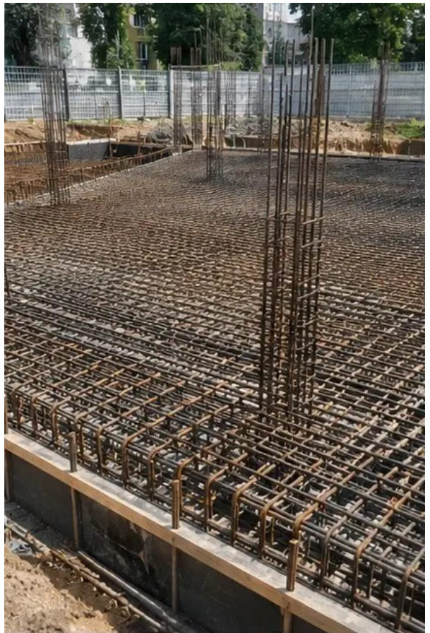
Слика бр.4 Постављање арматуре завршено пре бетонирања