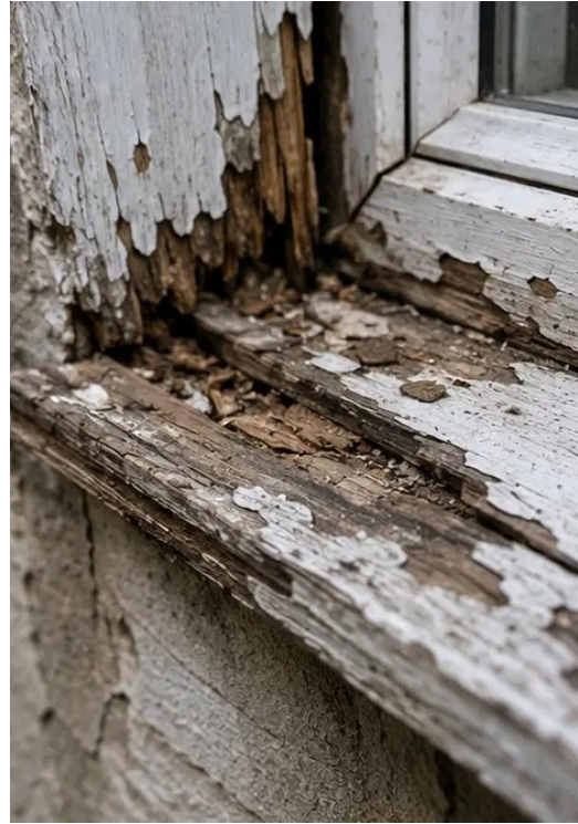
Foto Nr.14 Fotografi nga afër si provë e dëmit të identifikuar