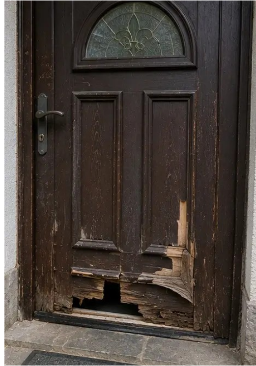
Foto Nr.8 Dera e hyrjes e dëmtuar e regjistruar gjatë inspektimit