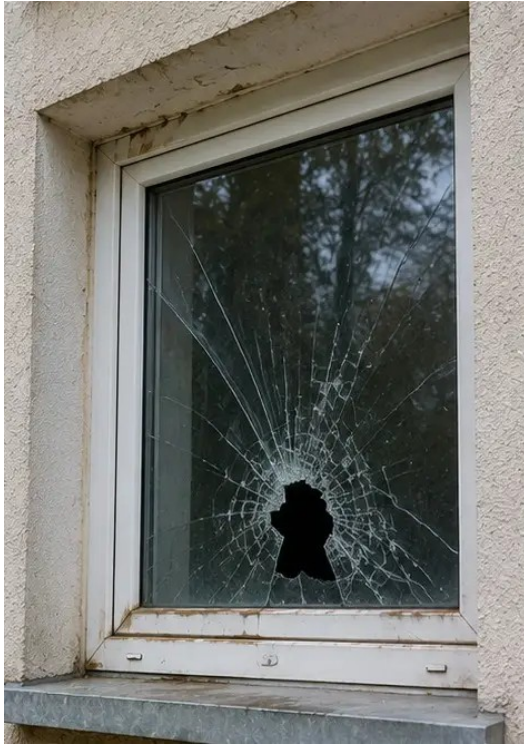
Foto Nr.7 Dritarja e dëmtuar e dokumentuar për vlerësim