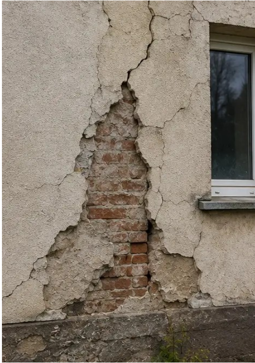
Foto Nr.4 Dëmtimi i murit të jashtëm i dokumentuar për vlerësim