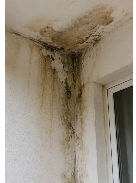
Foto Nr.6 Zona e dëmtimit nga uji e identifikuar dhe regjistruar