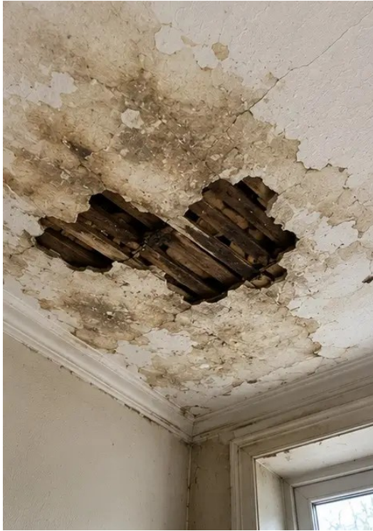
Foto Nr.10 Dëmtimi i tavanit i identifikuar dhe regjistruar