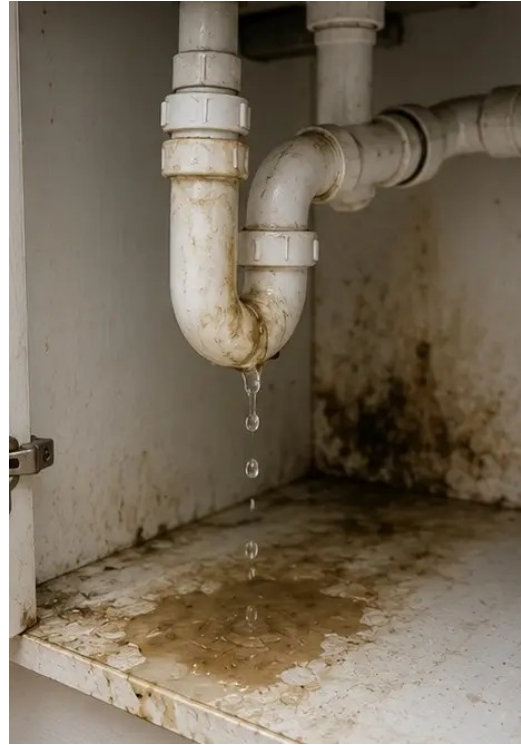
Foto Nr.11 Dëmtimi nga rrjedhja hidraulike i dokumentuar