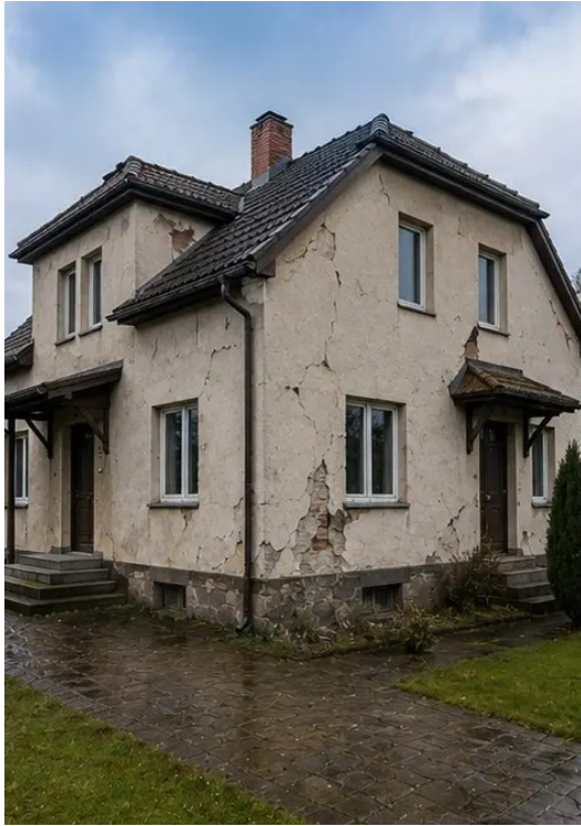
Foto Nr.1 Pamje e përgjithshme e pronës së inspektuar