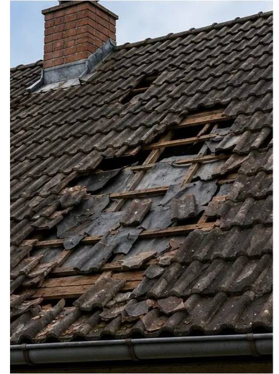
Foto Nr.3 Zona e çatisë së dëmtuar e identifikuar dhe regjistruar