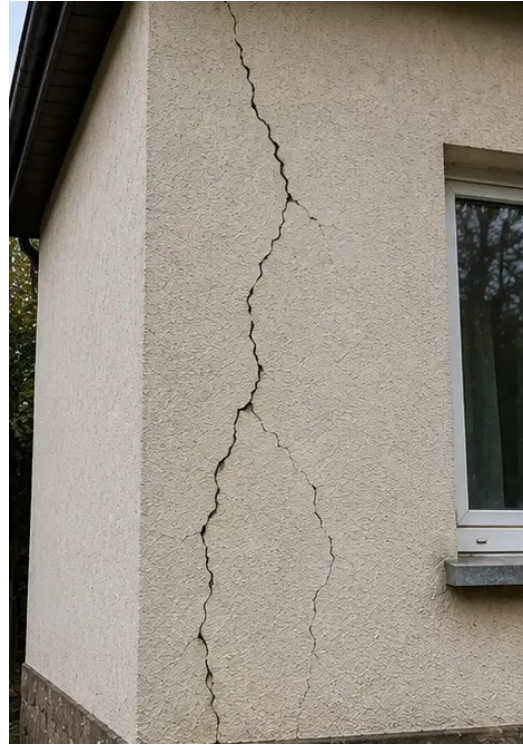
Foto Nr.5 Çarje në mur strukturor e dokumentuar gjatë inspektimit