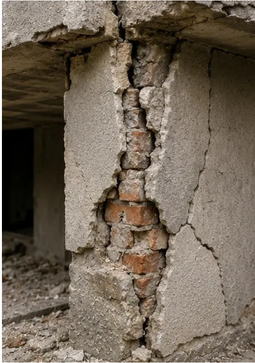
Foto Nr.13 Detaj i dëmtimit strukturor i dokumentuar për vlerësim