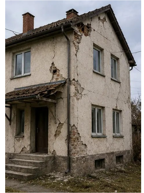
Foto Nr.15 Pasqyrë e shumë vendeve të dëmtimit