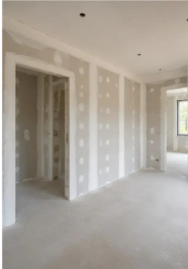
Foto Nr.11 Punimet e mbarimit të mureve të brendshme në vijim