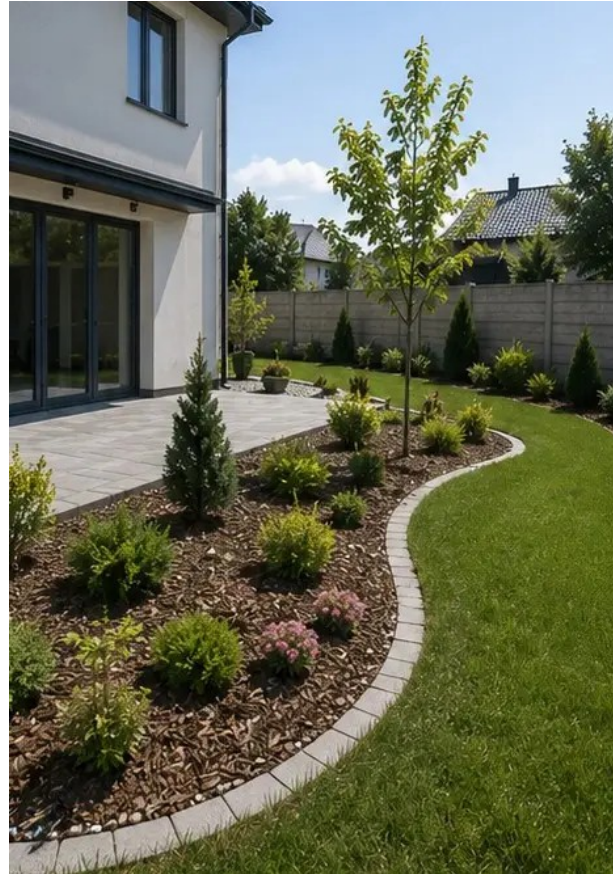
Foto Nr.14 Peizazhi i jashtëm përfundoi rreth objektit