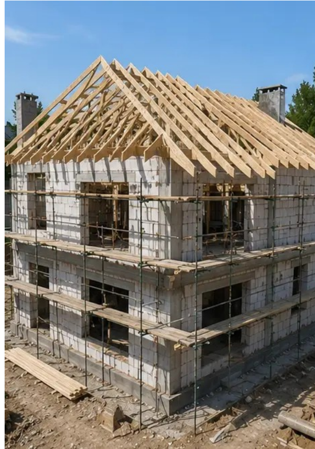
Foto Nr.8 Punimet e instalimit të çatisë përfunduan