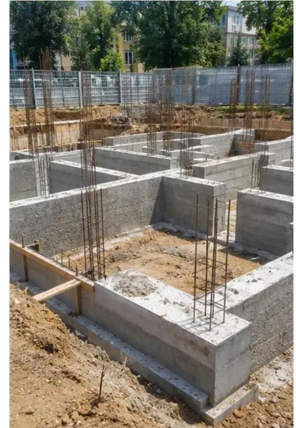
Foto Nr.3 Ndërtimi i themeleve në vijim