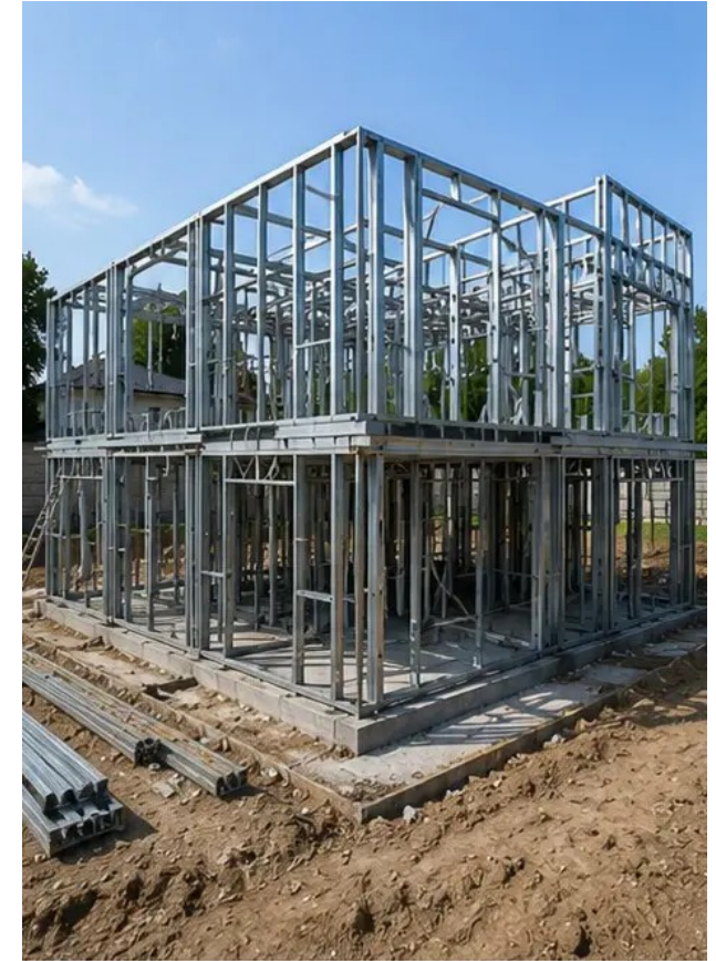
Foto Nr.6 Montimi i strukturës mbajtëse në vijim