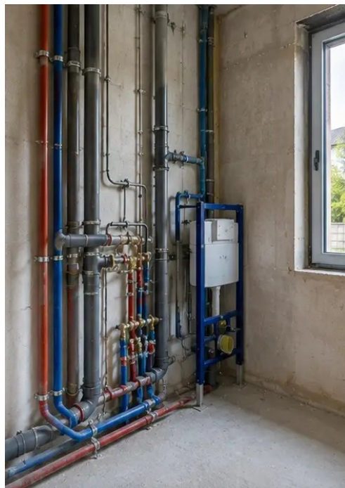
Foto Nr.11 Punimet e mbarimit të mureve të brendshme në vijim