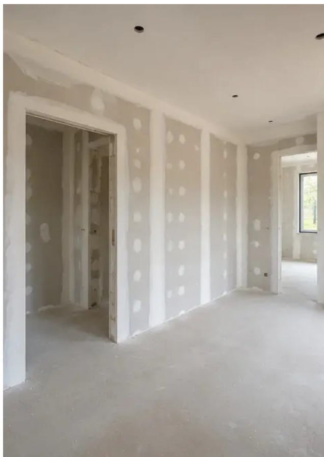
Foto Nr.11 Punimet e mbarimit të mureve të brendshme në vijim