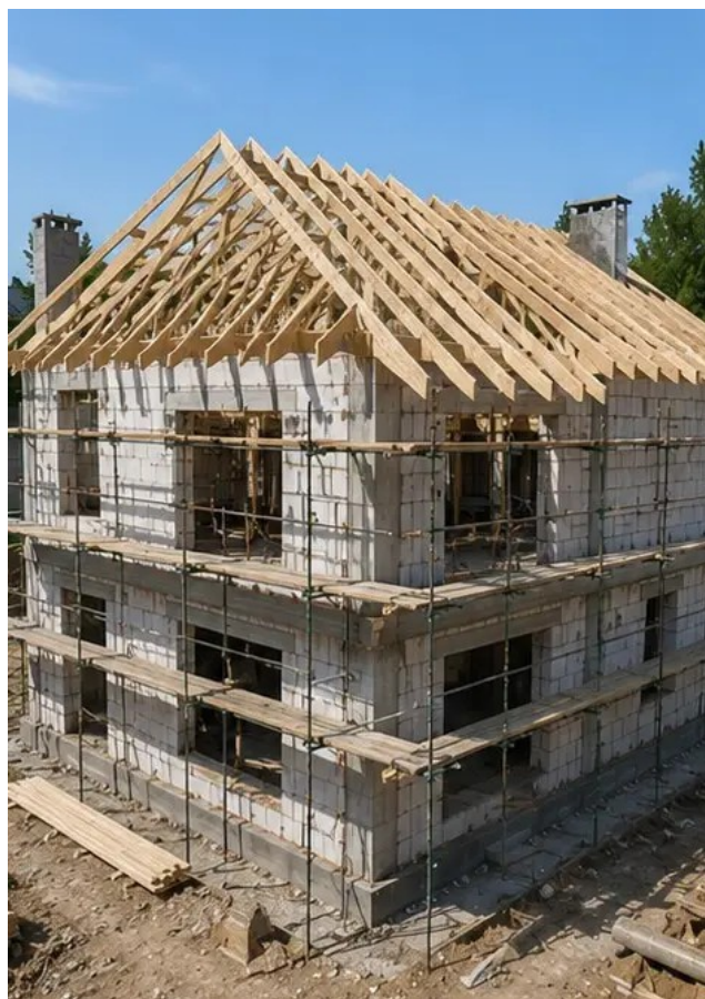
Foto Nr.8 Punimet e instalimit të çatisë përfunduan