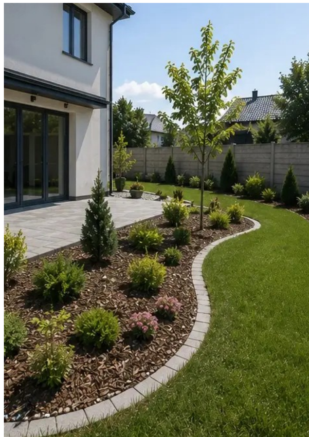
Foto Nr.14 Peizazhi i jashtëm përfundoi rreth objektit