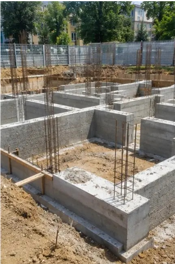
Foto Nr.3 Ndërtimi i themeleve në vijim