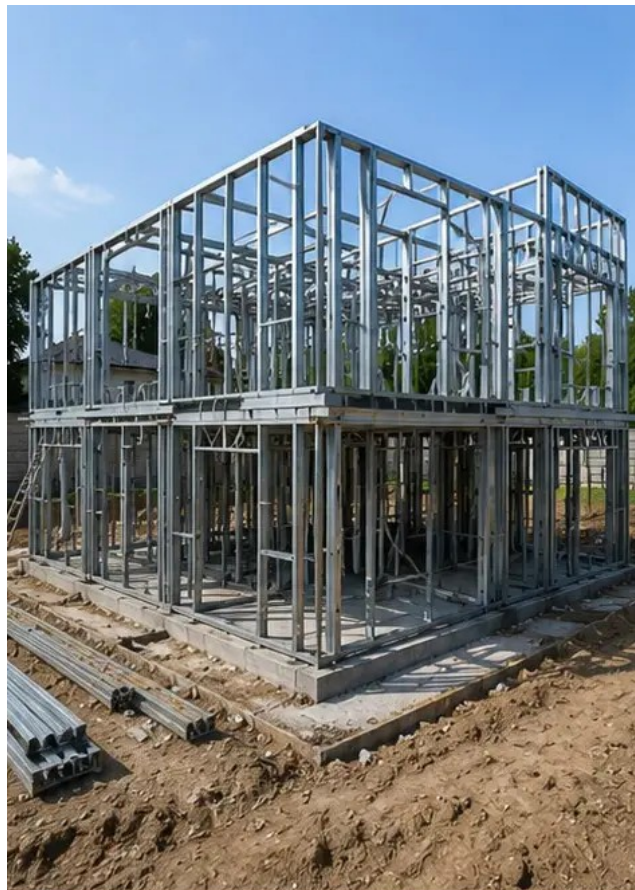
Foto Nr.6 Montimi i strukturës mbajtëse në vijim