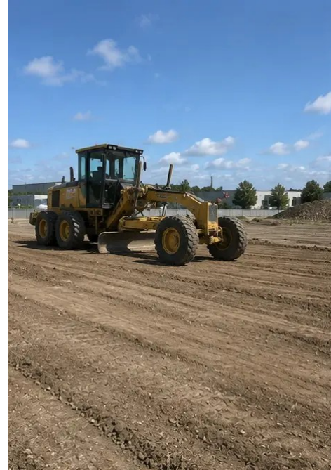
Foto Nr.3. Pastrimi dhe nivelimi i terrenit përfundoi