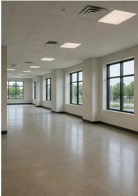
Foto Nr.13. Punimet e mbarimit të brendshëm në vijim