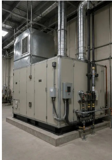
Foto Nr.14. Instalimi i pajisjeve përfundoi