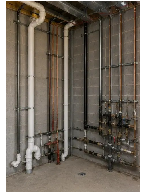
Foto Nr.12. Instalimi i sistemeve hidraulike përfundoi