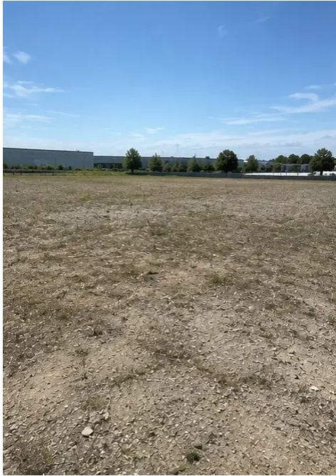
Foto Nr.1. Sheshi i projektit para fillimit të punimeve