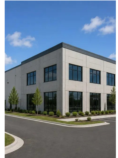
Foto Nr.16. Projekti i përfunduar gati për funksionim