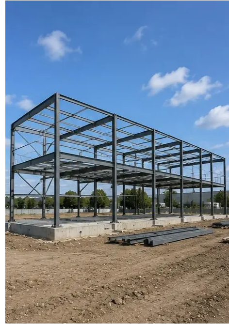
Foto Nr.7. Ndërtimi i strukturës mbajtëse në vijim