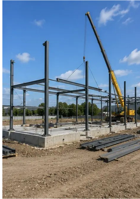
Foto Nr.6. Montimi i strukturës mbajtëse filloi