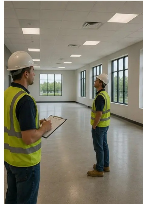
Foto Nr.15. Inspektimi përfundimtar i projektit u krye