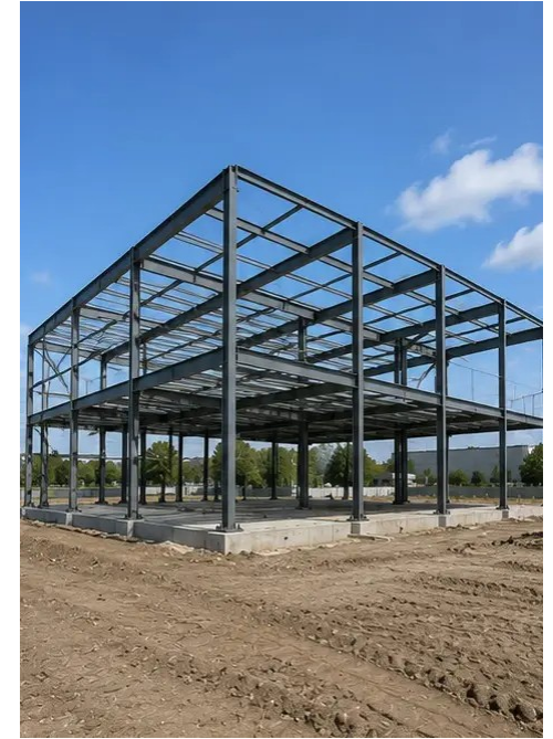
Foto Nr.8. Struktura mbajtëse përfundoi sipas planit të projektit