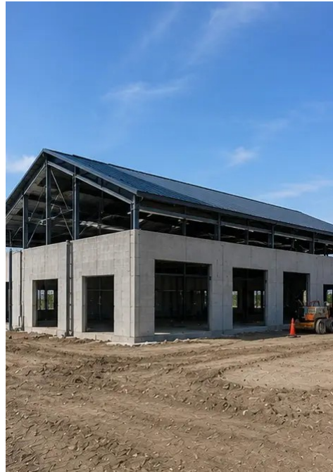
Foto Nr.10. Ndërtimi i çatisë përfundoi