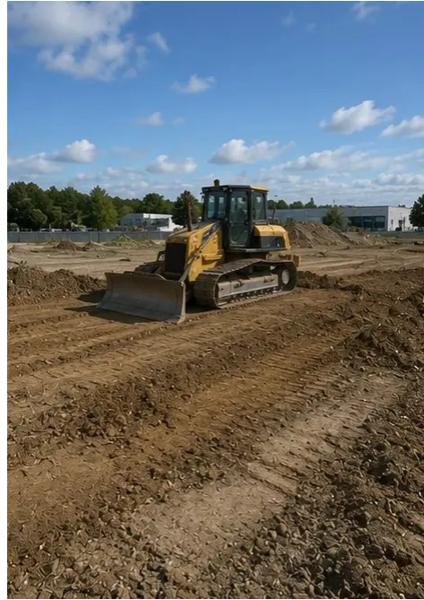
Foto Nr.2. Aktivitetet e përgatitjes së sheshit në vijim