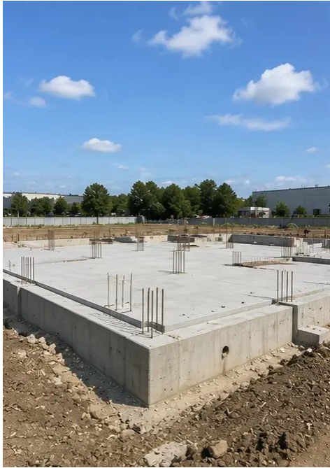
Foto Nr.5. Ndërtimi i themeleve përfundoi