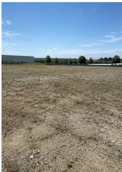
Foto Nr.1. Sheshi i projektit para fillimit të punimeve