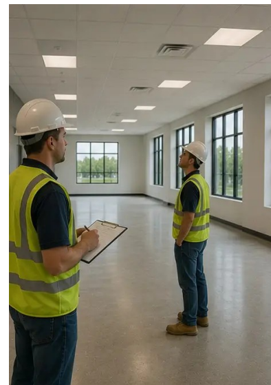
Foto Nr.15. Inspektimi përfundimtar i projektit u krye