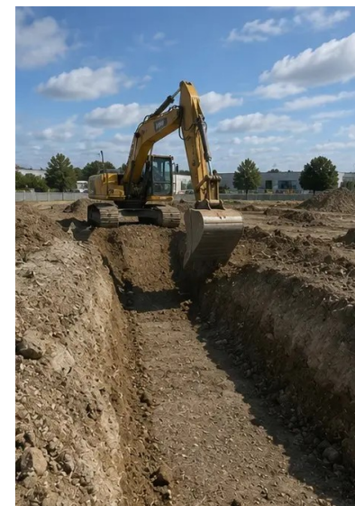
Foto Nr.4. Punimet fillestare të gërmimit përfunduan