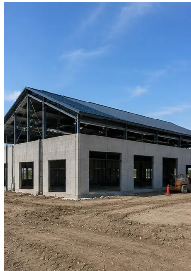
Foto Nr.10. Ndërtimi i çatisë përfundoi