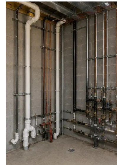
Foto Nr.12. Instalimi i sistemeve hidraulike përfundoi