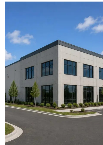
Foto Nr.16. Projekti i përfunduar gati për funksionim