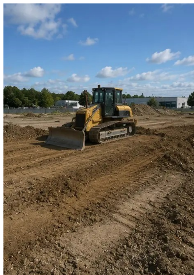
Foto Nr.2. Aktivitetet e përgatitjes së sheshit në vijim