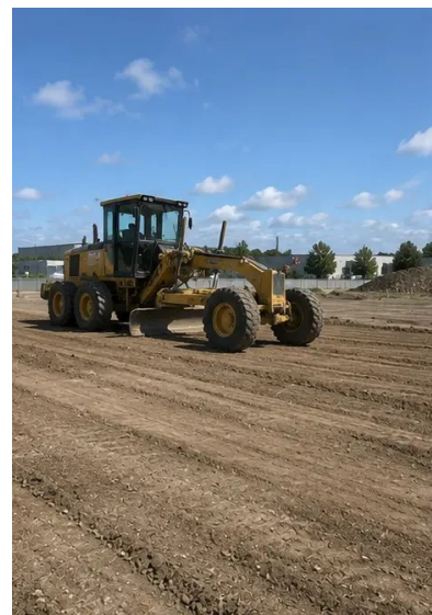
Foto Nr.3. Pastrimi dhe nivelimi i terrenit përfundoi