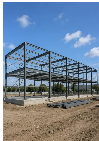
Foto Nr.7. Ndërtimi i strukturës mbajtëse në vijim