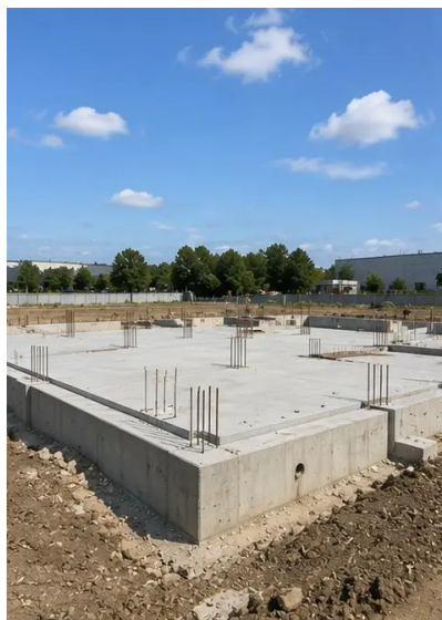
Foto Nr.5. Ndërtimi i themeleve përfundoi