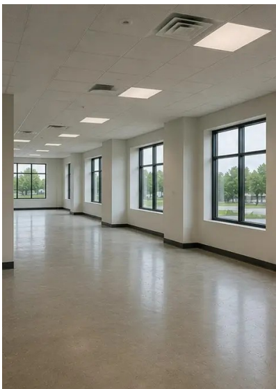
Foto Nr.13. Punimet e mbarimit të brendshëm në vijim