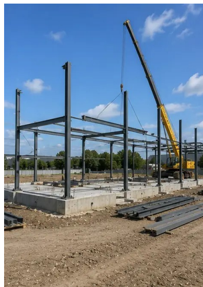
Foto Nr.6. Montimi i strukturës mbajtëse filloi