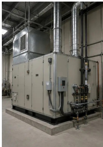
Foto Nr.14. Instalimi i pajisjeve përfundoi