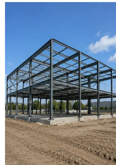
Foto Nr.8. Struktura mbajtëse përfundoi sipas planit të projektit