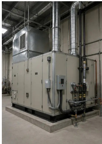
Foto Nr.14. Instalimi i pajisjeve përfundoi