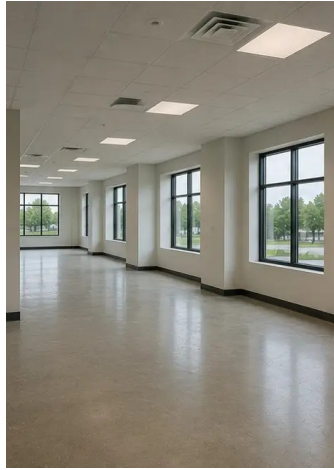
Foto Nr.13. Punimet e mbarimit të brendshëm në vijim