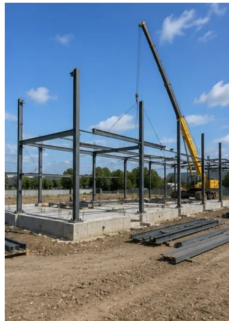
Foto Nr.6. Montimi i strukturës mbajtëse filloi