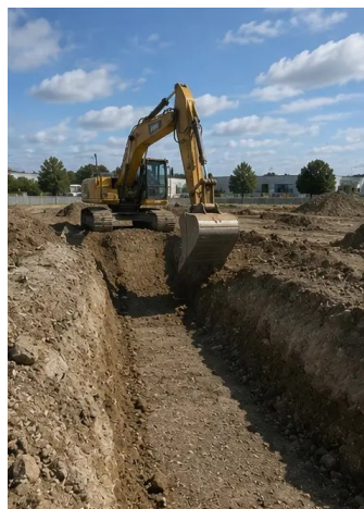
Foto Nr.4. Punimet fillestare të gërmimit përfunduan