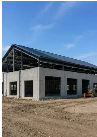
Foto Nr.10. Ndërtimi i çatisë përfundoi