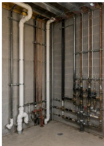
Foto Nr.12. Instalimi i sistemeve hidraulike përfundoi