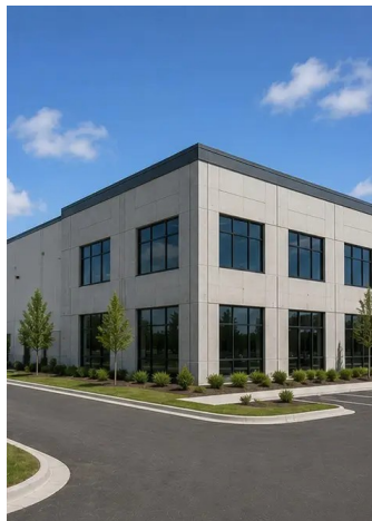
Foto Nr.16. Projekti i përfunduar gati për funksionim