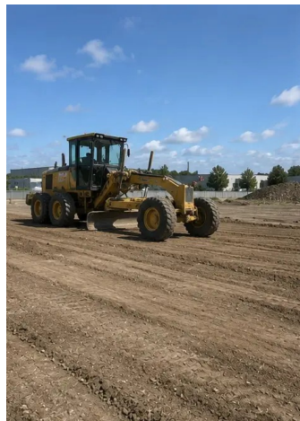
Foto Nr.3. Pastrimi dhe nivelimi i terrenit përfundoi