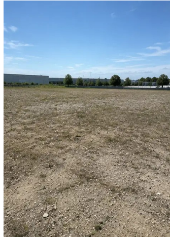
Foto Nr.1. Sheshi i projektit para fillimit të punimeve