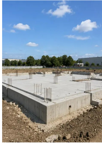
Foto Nr.5. Ndërtimi i themeleve përfundoi