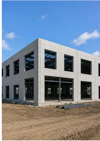
Foto Nr.9. Struktura mbajtëse përfundoi sipas planit të projektit