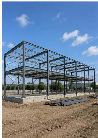
Foto Nr.7. Ndërtimi i strukturës mbajtëse në vijim