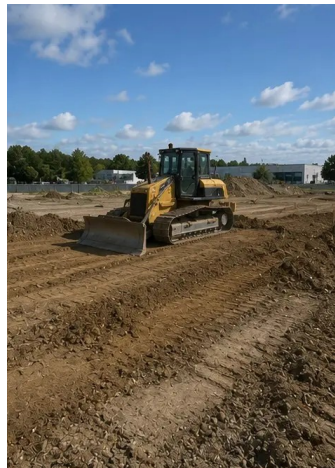
Foto Nr.2. Aktivitetet e përgatitjes së sheshit në vijim