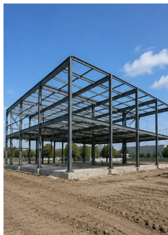
Foto Nr.8. Struktura mbajtëse përfundoi sipas planit të projektit