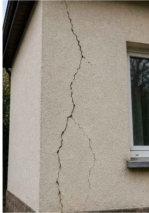
Foto št.5 Razpoka v nosilni steni dokumentirana med pregledom