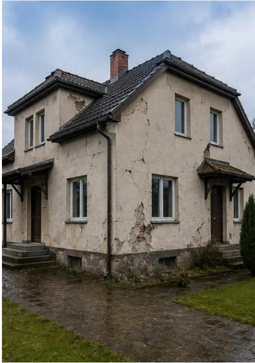
Foto št.1 Splošen pogled na pregledano nepremičnino