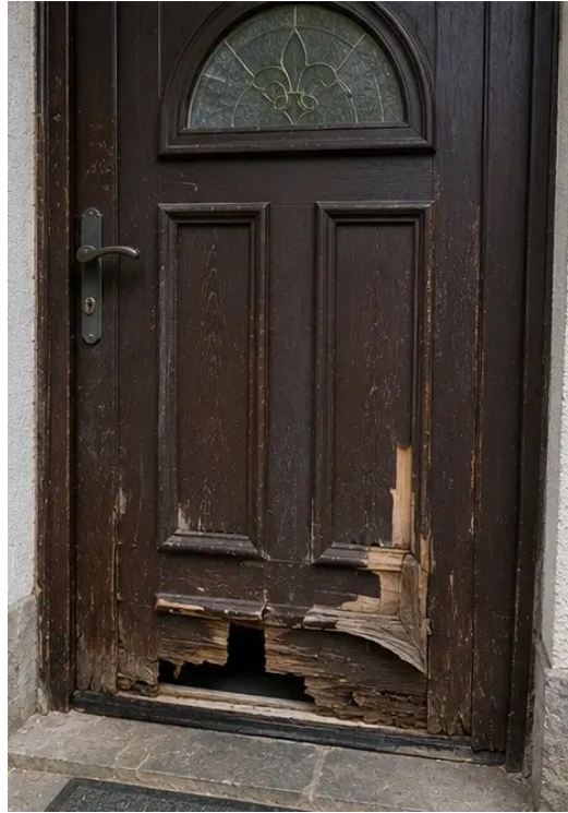
Foto št.8 Poškodovana vhodna vrata zabeležena med pregledom