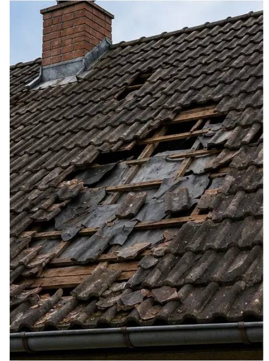
Foto št.3 Poškodovano območje strehe identificirano in zabeleženo