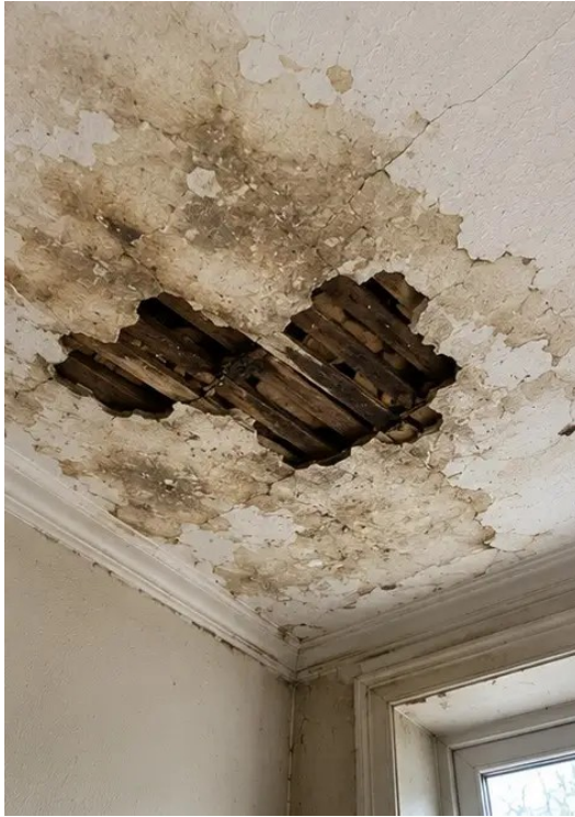
Foto št.10 Poškodba stropa identificirana in zabeležena