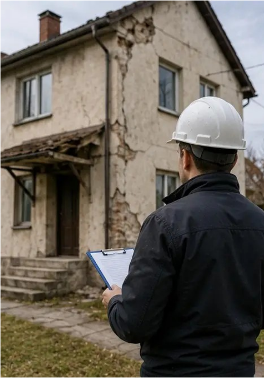
Foto št.16 Končna povzetek fotografija pregleda poškodb