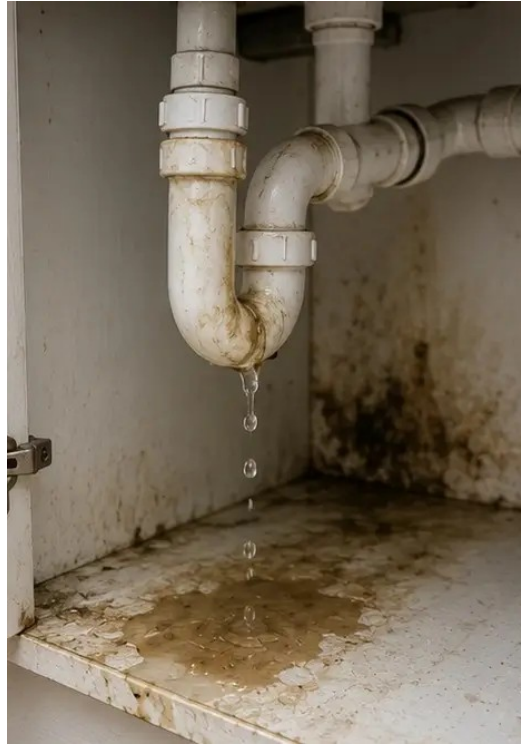
Foto št.11 Poškodba zaradi puščanja vodovoda dokumentirana