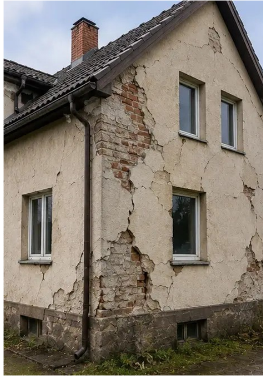
Foto št.2 Pregled zunanjih poškodb, dokumentiranih med pregledom