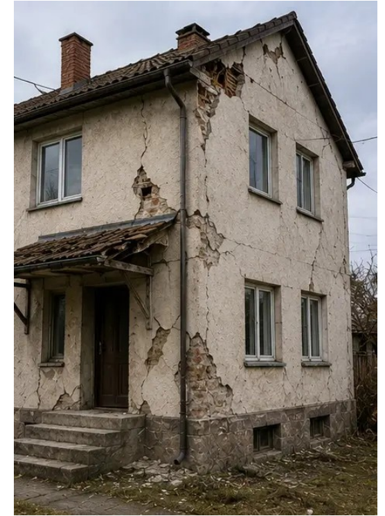
Foto št.15 Pregled več lokacij poškodb