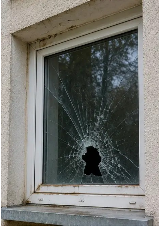
Foto št.7 Poškodovano okno dokumentirano za ovrednotenje