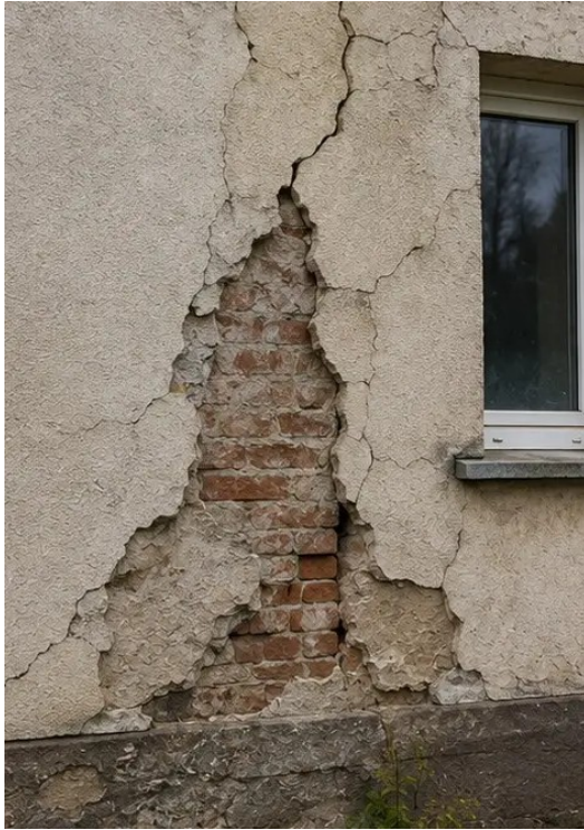
Foto št.4 Poškodba zunanje stene dokumentirana za oceno