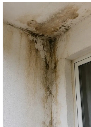
Photo #6. Območje poškodb zaradi vode identificirano in zabeleženo