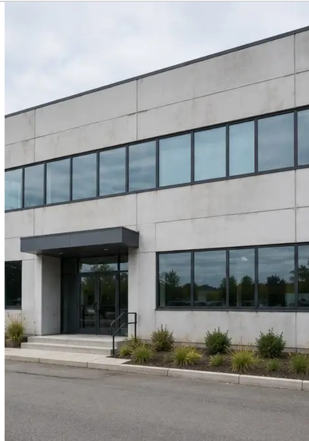
Foto št.3 Območje glavnega vhoda pregledano in dokumentirano