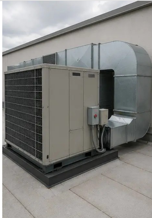
Foto št.12 Varnostna oprema pregledana in zabeležena