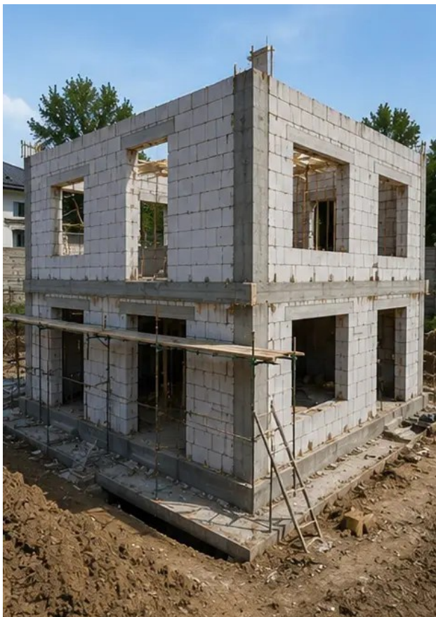
Foto št.7 Gradnja zunanjih sten zaključena za del stavbe