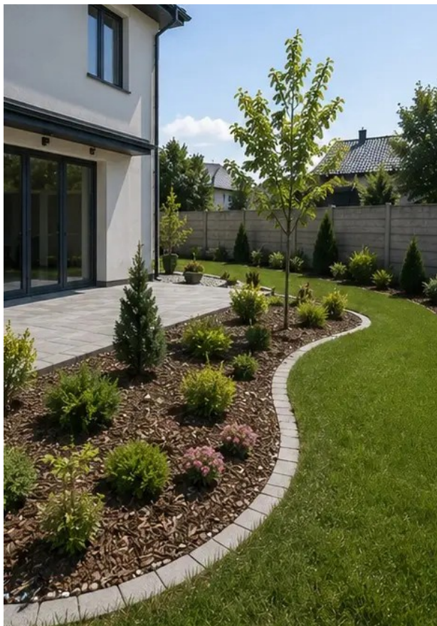
Foto št.14 Zunanja ureditev okolice objekta zaključena