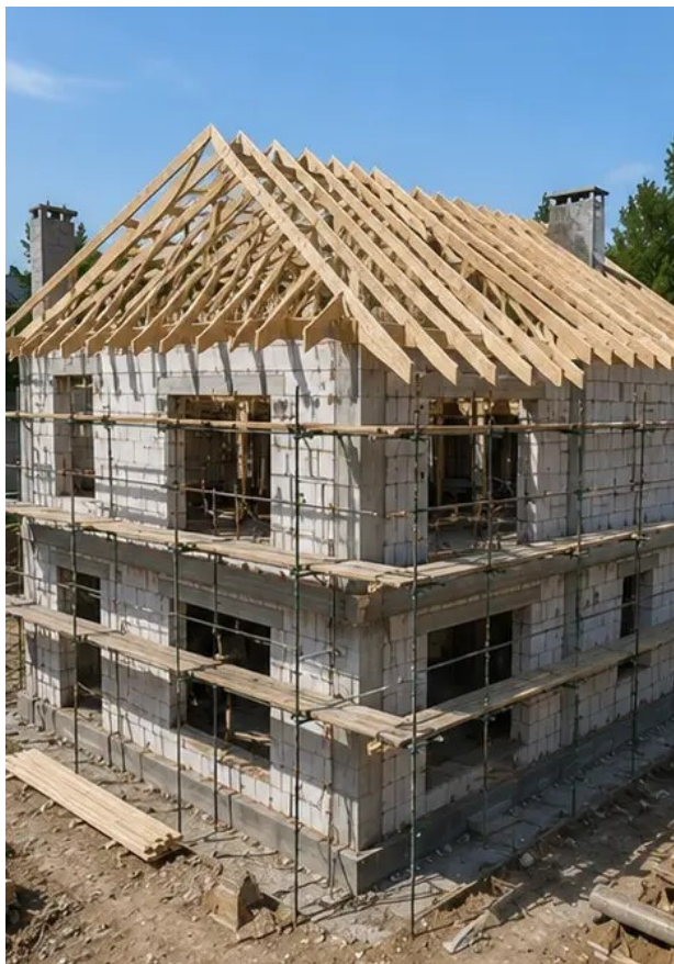
Foto št.8 Montaža strehe zaključena