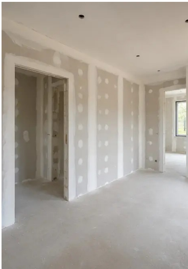
Foto št.11 Zaključna dela na notranjih stenah v teku