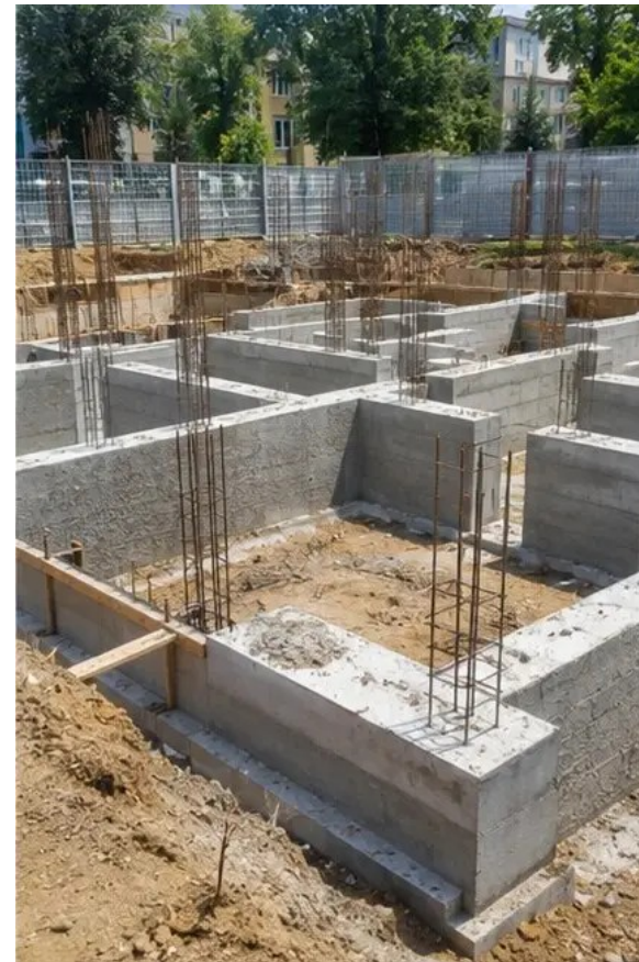
Foto št.3 Gradnja temeljev v teku