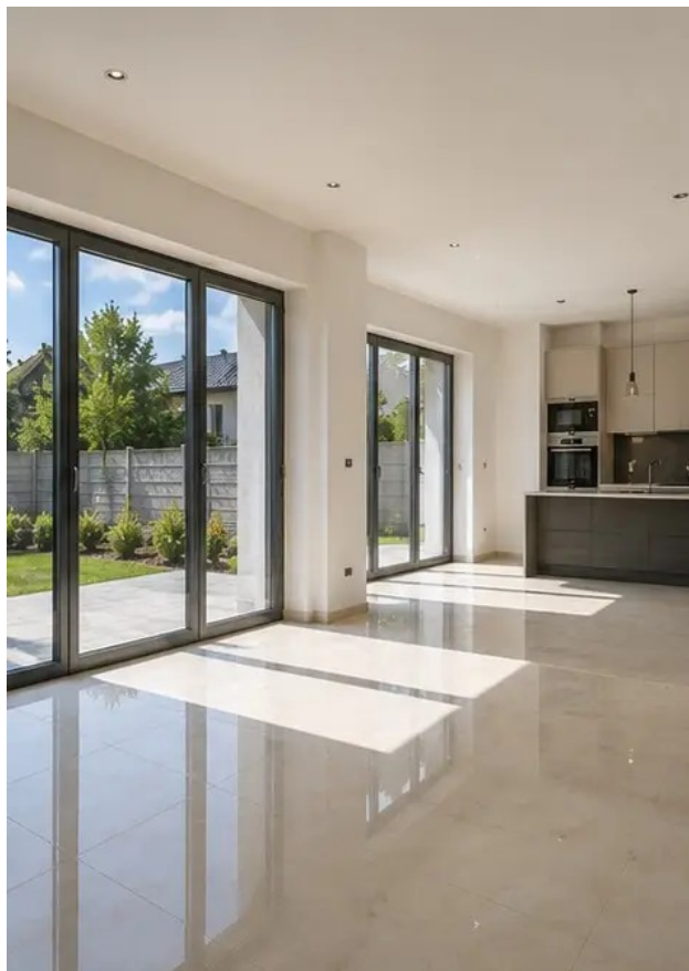
Foto št.16 Končana notranjost stavbe pripravljena za obratovanje