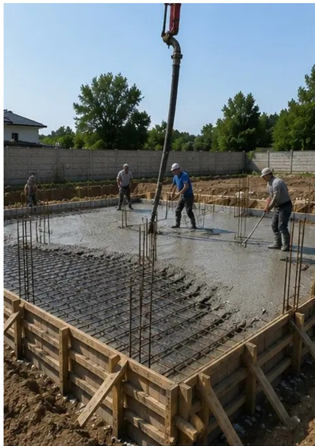
Foto št.5 Betoniranje izvedeno na temeljnih elementih