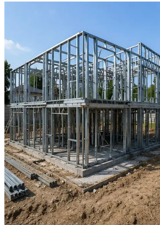
Foto št.6 Montaža nosilne konstrukcije v teku