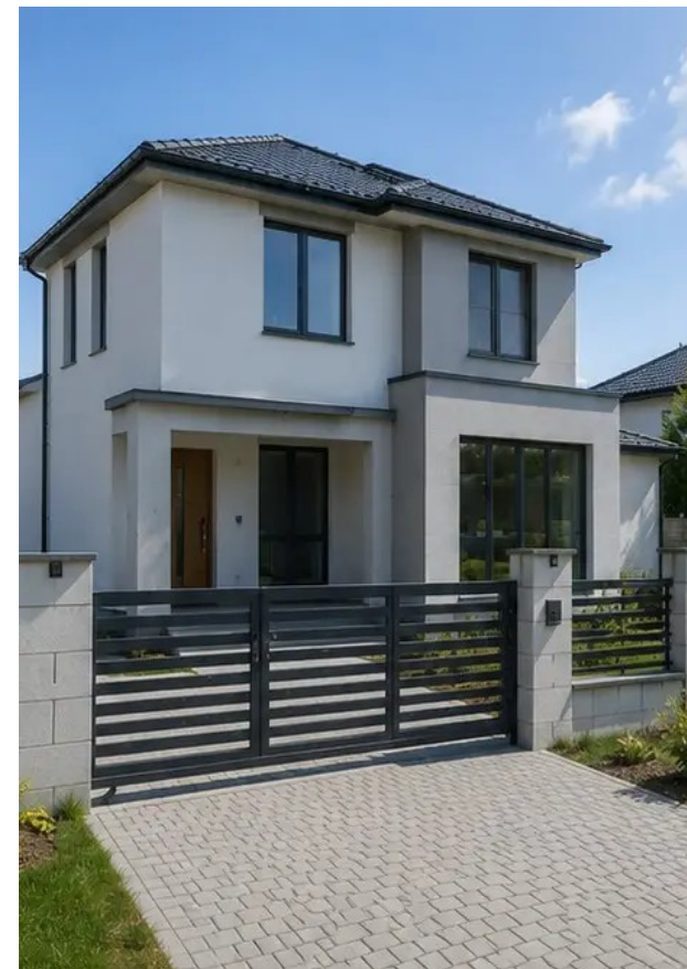
Foto št.15 Končana zunanost stavbe po gradnji