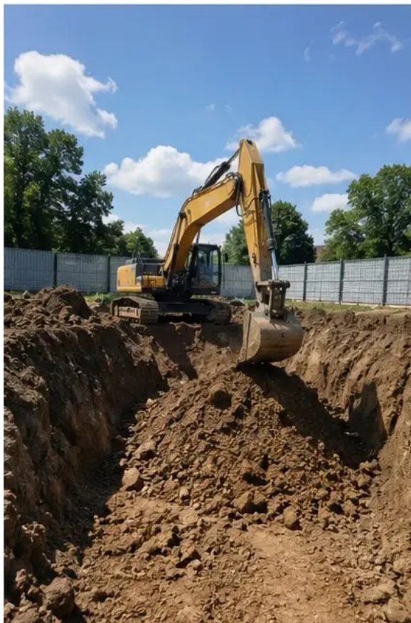
Foto št.2 Izkopi izvedeni skladno s projektnimi zahtevami