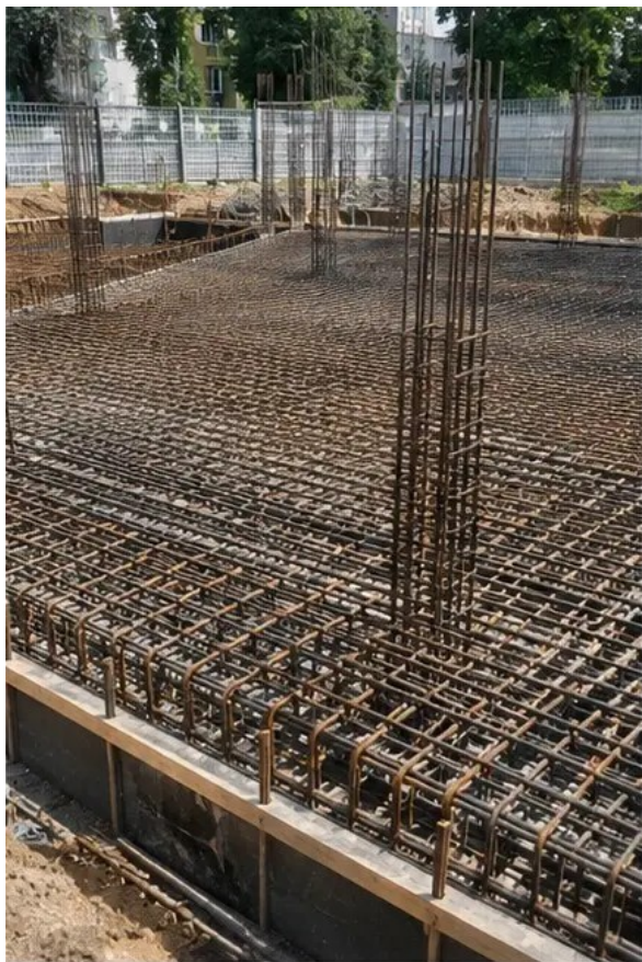
Foto št.4 Montaža armature končana pred betoniranjem