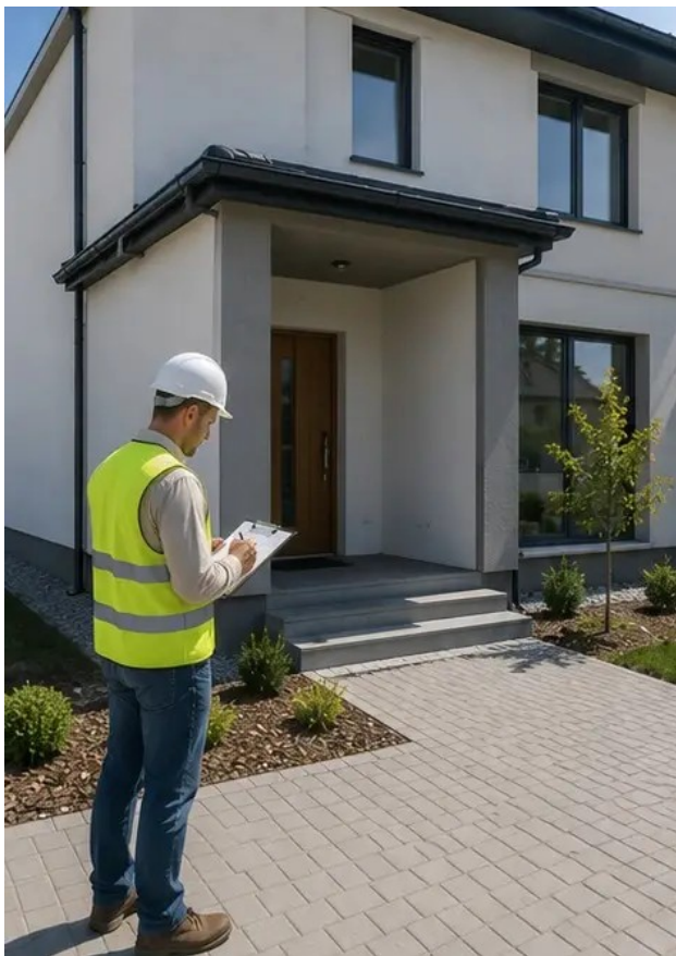
Foto št.13 Končni pregled dokončanih gradbenih del