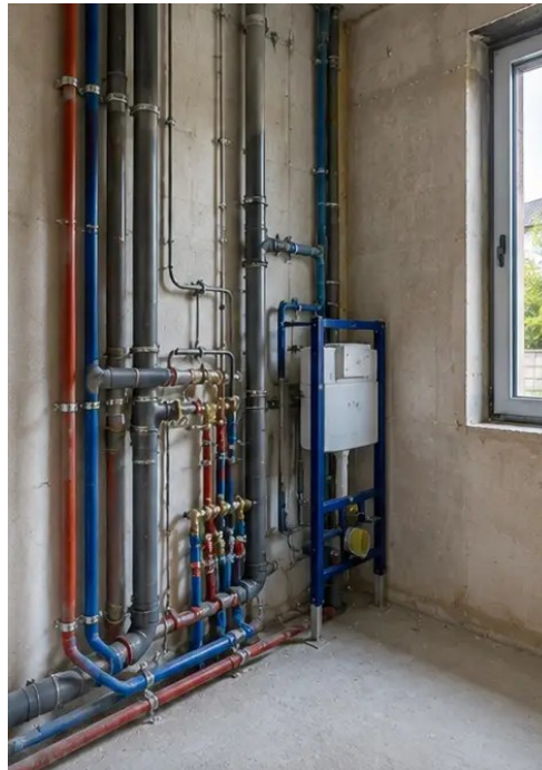
Foto št.11 Zaključna dela na notranjih stenah v teku