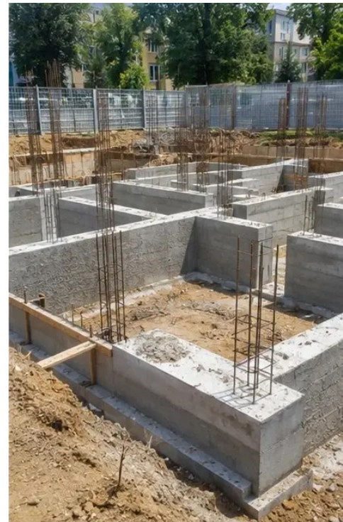
Foto št.4 Montaža armature končana pred betoniranjem