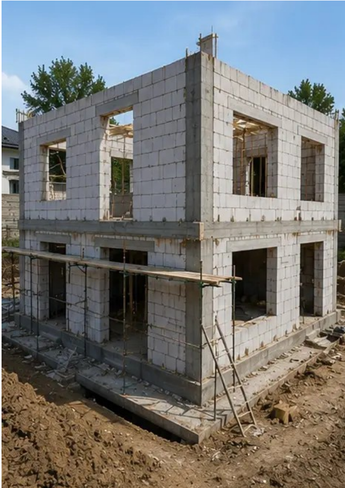
Foto št.7 Gradnja zunanjih sten zaključena za del stavbe