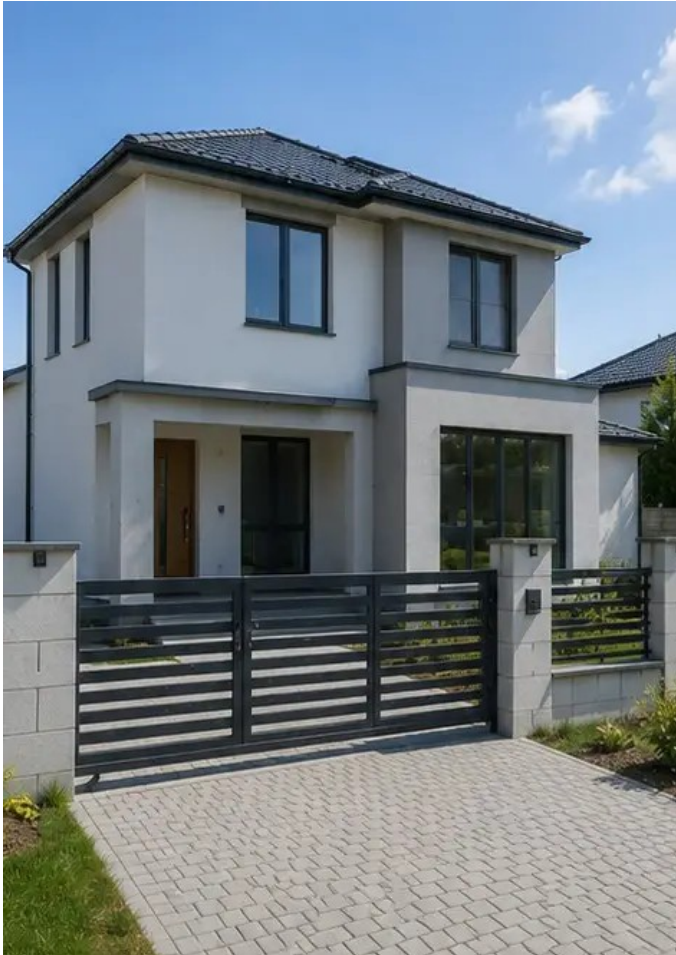
Foto št.15 Končana zunanost stavbe po gradnji