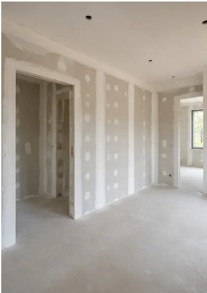
Foto št.11 Zaključna dela na notranjih stenah v teku