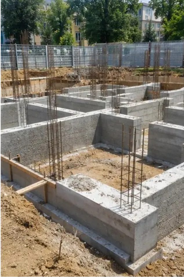
Foto št.4 Montaža armature končana pred betoniranjem