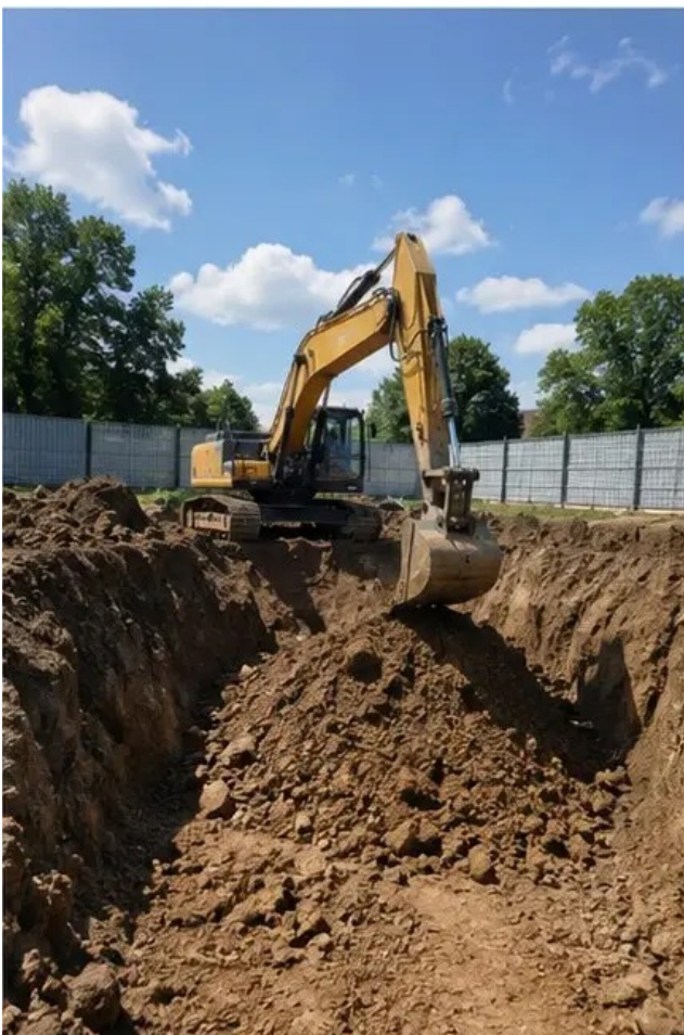
Foto št.2 Izkopi izvedeni skladno s projektnimi zahtevami