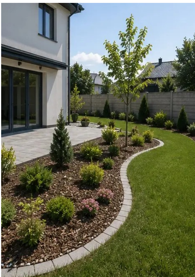
Foto št.14 Zunanja ureditev okolice objekta zaključena