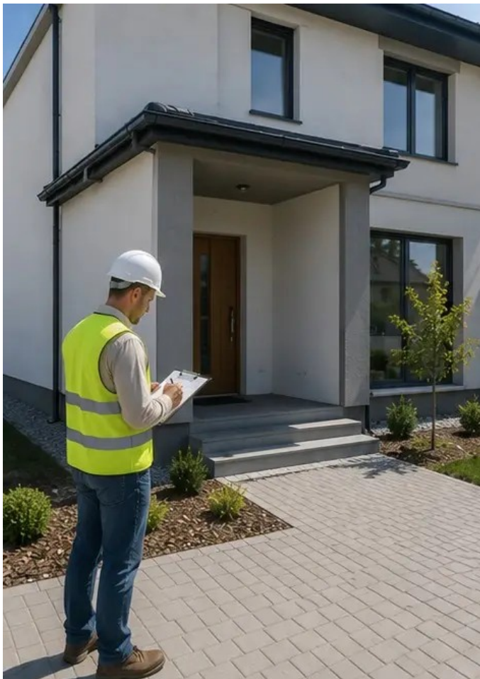
Foto št.13 Končni pregled dokončanih gradbenih del