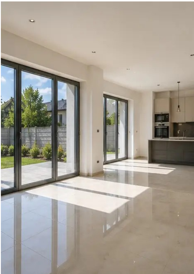
Foto št.16 Končana notranost stavbe pripravljena za obratovanje