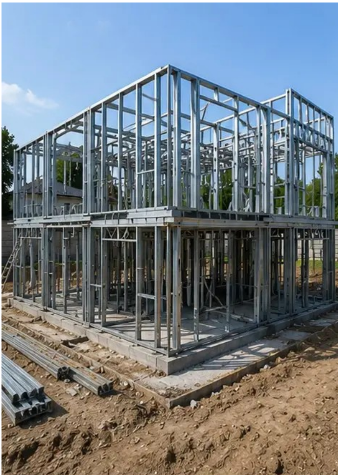
Foto št.6 Montaža nosilne konstrukcije v teku