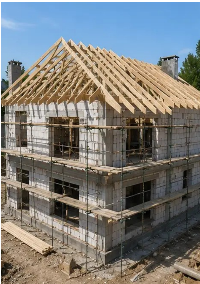
Foto št.8 Montaža strehe zaključena