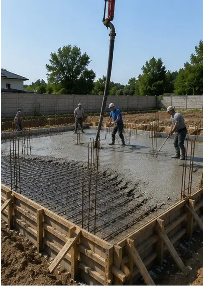
Foto št.5 Betoniranje izvedeno na temeljnih elementih