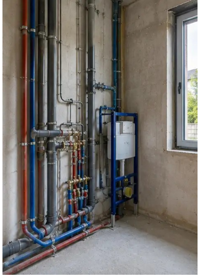
Foto št.10 Montaža vodovodnih sistemov zaključena na določenih območjih