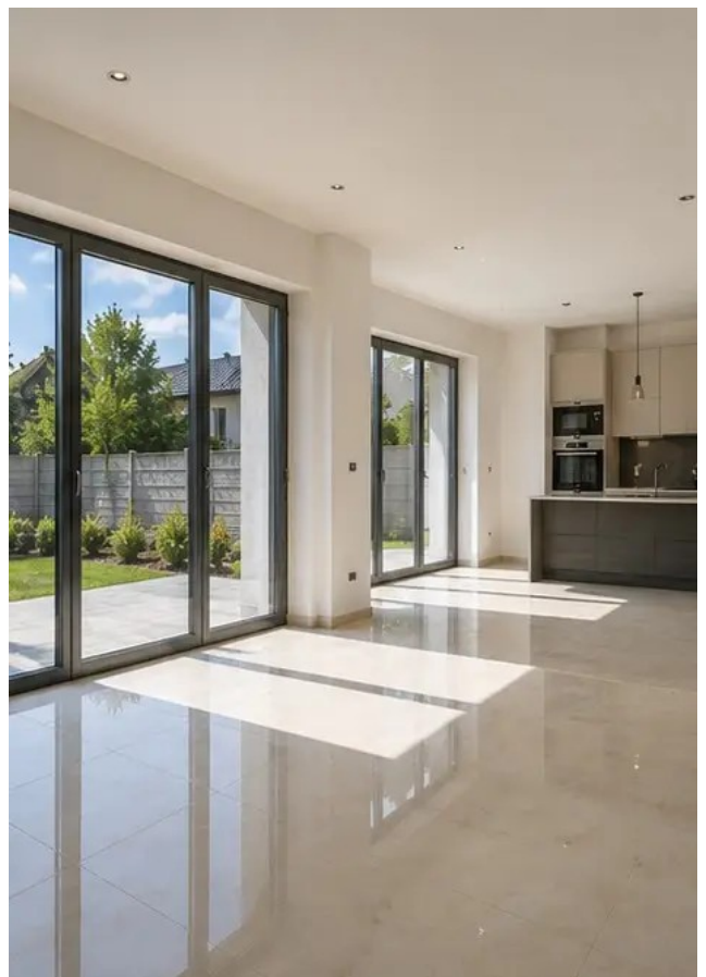
Foto št.16 Končana notranost stavbe pripravljena za obratovanje