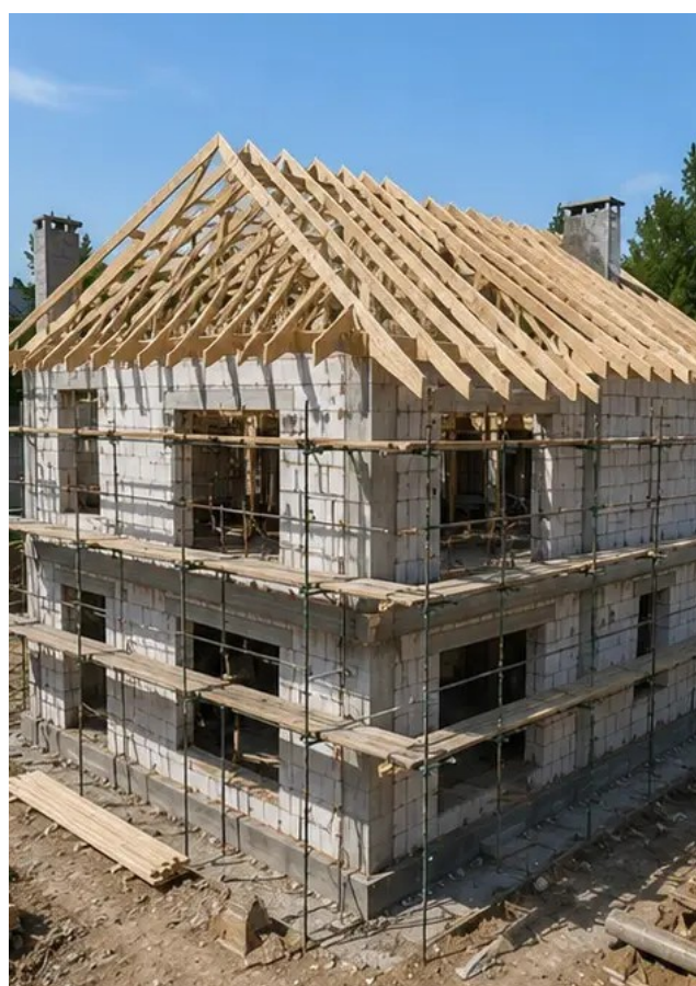
Foto št.8 Montaža strehe zaključena