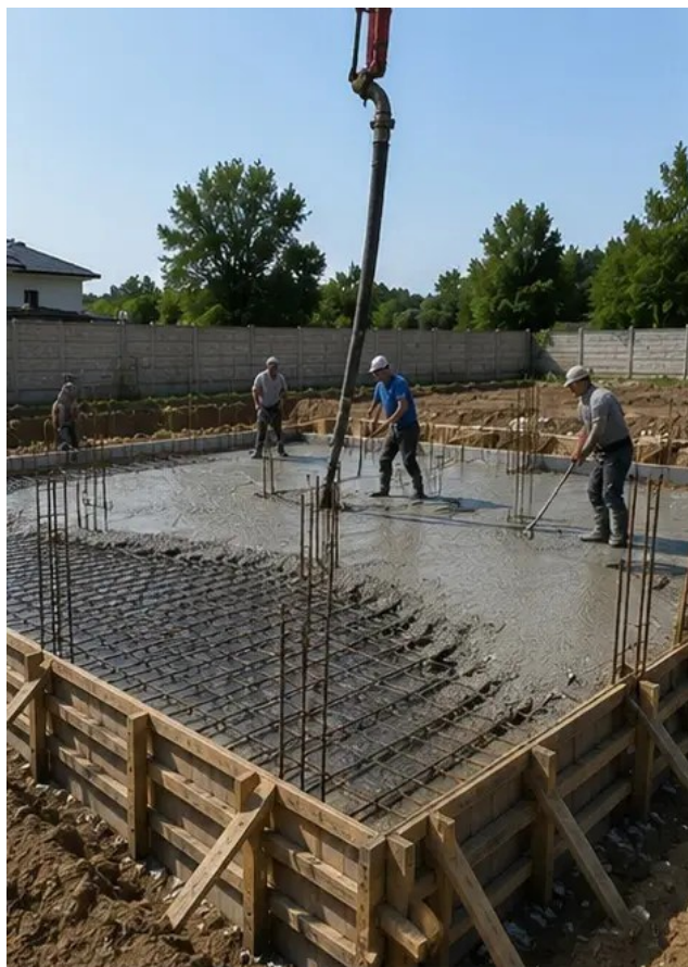
Foto št.5 Betoniranje izvedeno na temeljnih elementih