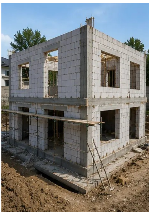
Foto št.7 Gradnja zunanjih sten zaključena za del stavbe