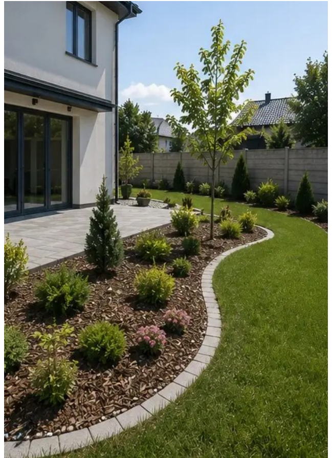
Foto št.14 Zunanja ureditev okolice objekta zaključena