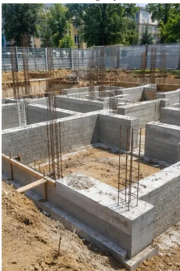
Foto št.3 Gradnja temeljev v teku