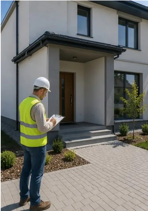
Foto št.13 Končni pregled dokončanih gradbenih del