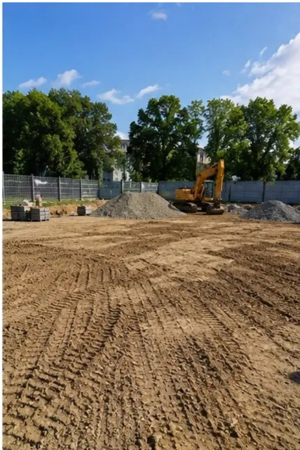
Foto št.1 Pripravljalna dela na gradbišču zaključena pred začetkom gradnje