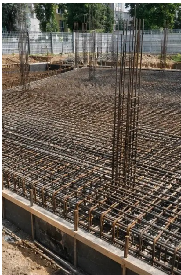
Foto št.4 Montaža armature končana pred betoniranjem