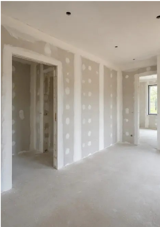
Foto št.11 Zaključna dela na notranjih stenah v teku