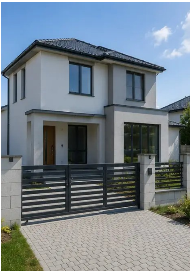
Foto št.15 Končana zunanost stavbe po gradnji