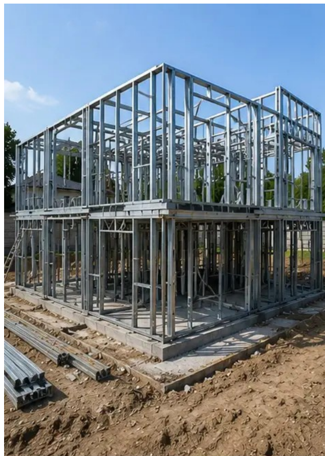
Foto št.6 Montaža nosilne konstrukcije v teku