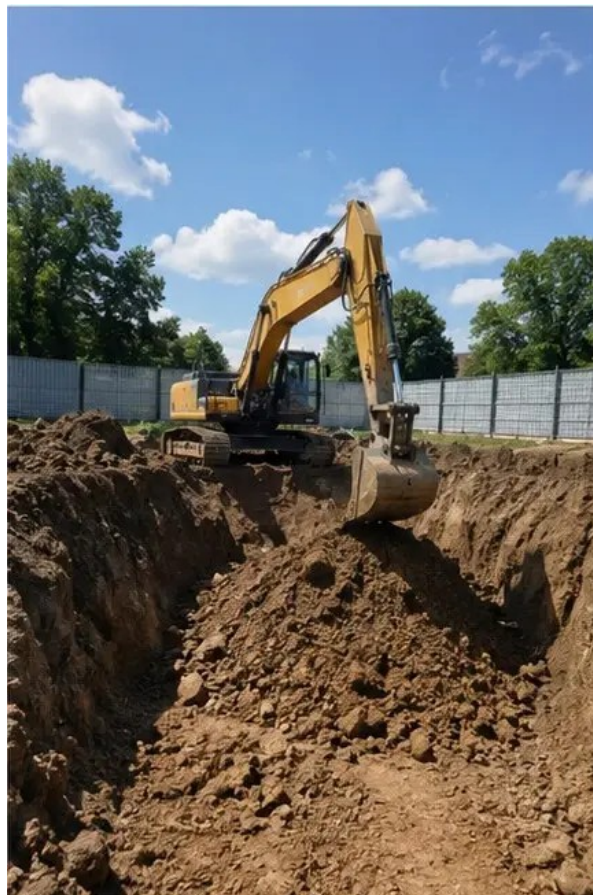
Foto št.2 Izkopi izvedeni skladno s projektnimi zahtevami