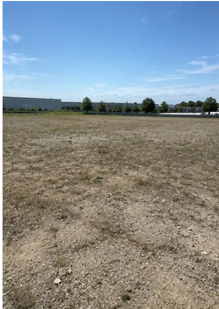
Foto št.2. Pripravljalne dejavnosti na gradbišču v teku