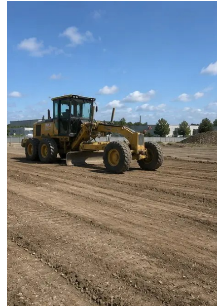
Foto št.4. Začetna izkopna dela zaključena