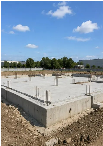
Foto št.6. Montaža nosilne konstrukcije začeta