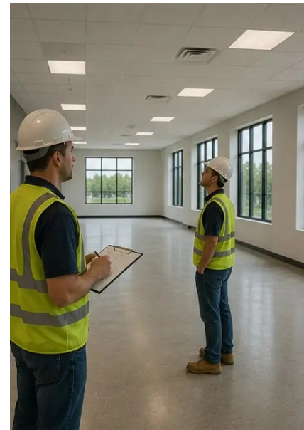
Foto št.16. Dokončan projekt pripravljen za obratovanje