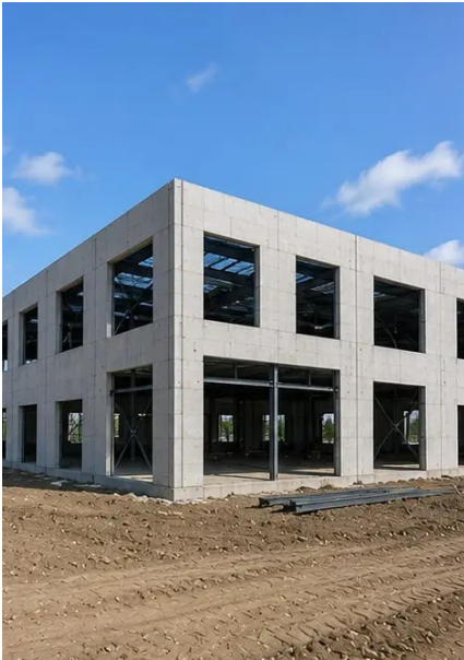
Foto št.10. Gradnja strehe končana