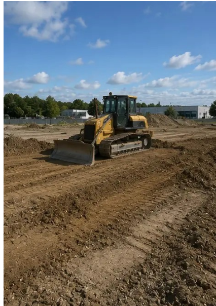
Foto št.3. Čiščenje in izravnava terena končana