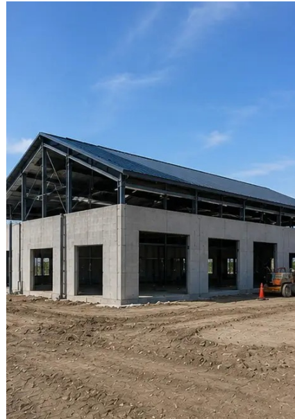
Foto št.11. Montaža električnih sistemov v teku