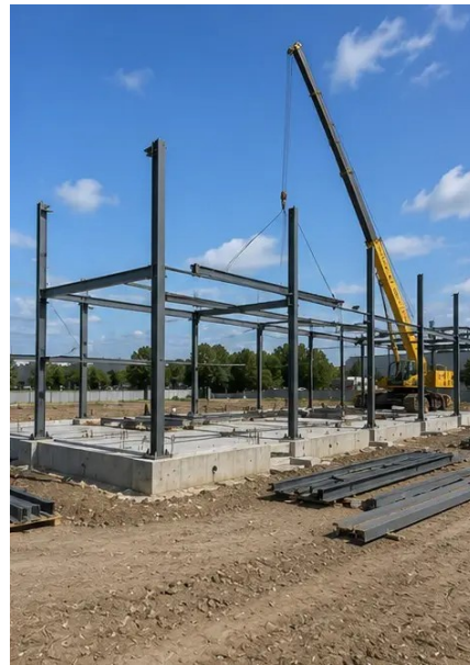
Foto št.7. Gradnja nosilne konstrukcije v teku