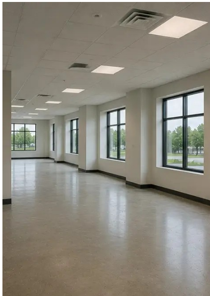
Foto št.14. Montaža opreme zaključena