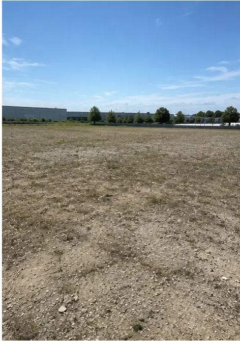
Foto št.1. Gradbišče pred začetkom del