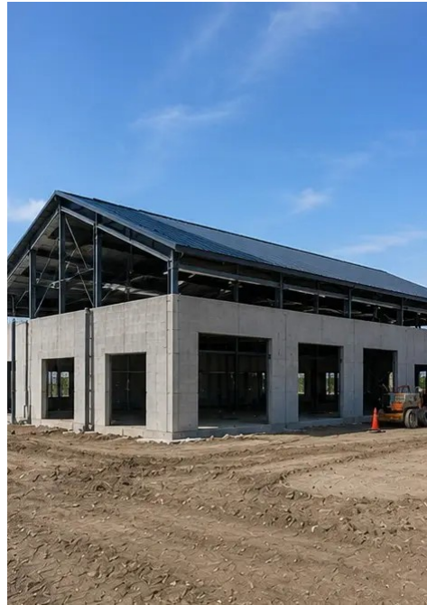
Foto št.10. Gradnja strehe končana