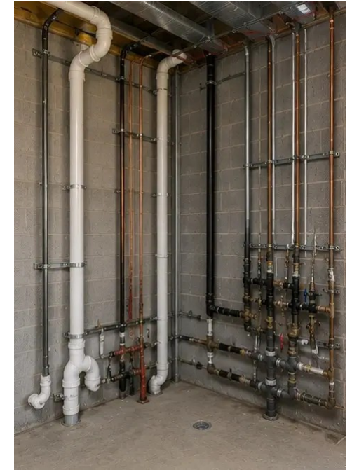
Foto št.12. Montaža vodovodnih sistemov zaključena