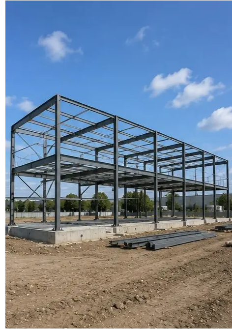
Foto št.7. Gradnja nosilne konstrukcije v teku