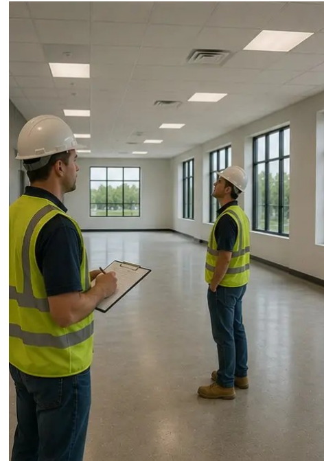
Foto št.15. Končni pregled projekta opravljen