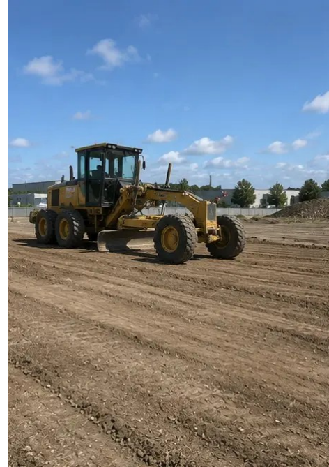
Foto št.3. Čiščenje in izravnava terena končana