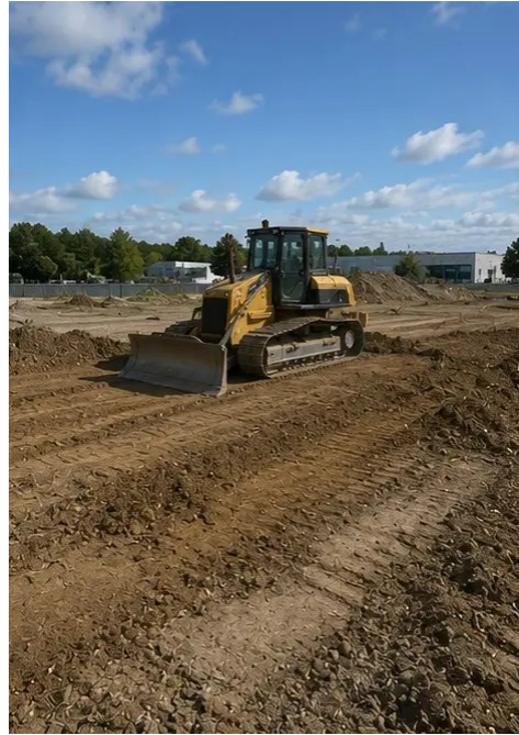
Foto št.2. Pripravljalne dejavnosti na gradbišču v teku