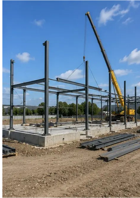
Foto št.6. Montaža nosilne konstrukcije začeta