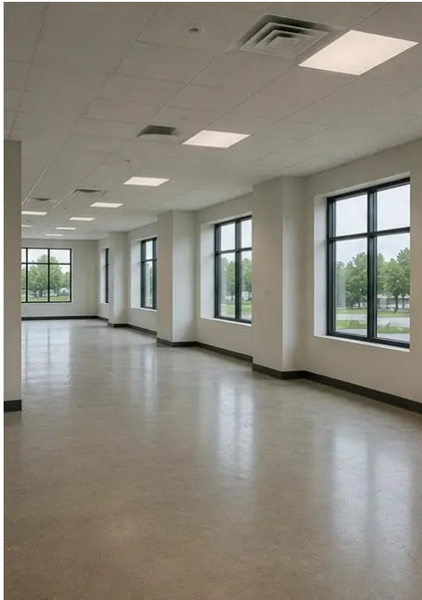
Foto št.13. Notranja zaključna dela v teku