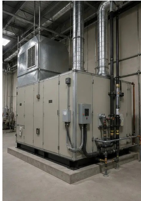
Foto št.14. Montaža opreme zaključena