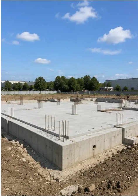
Foto št.5. Gradnja temeljev zaključena