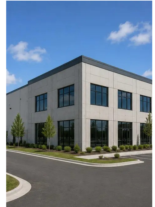
Foto št.16. Dokončan projekt pripravljen za obratovanje