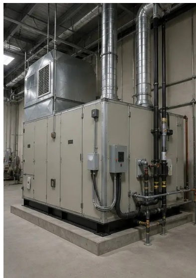
Foto št.14. Montaža opreme zaključena