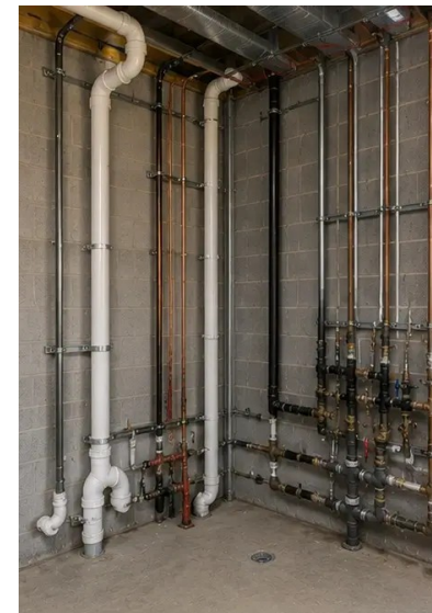
Foto št.12. Montaža vodovodnih sistemov zaključena