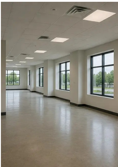
Foto št.13. Notranja zaključna dela v teku