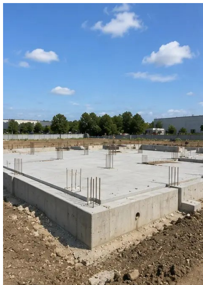
Foto št.5. Gradnja temeljev zaključena