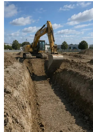
Foto št.4. Začetna izkopna dela zaključena