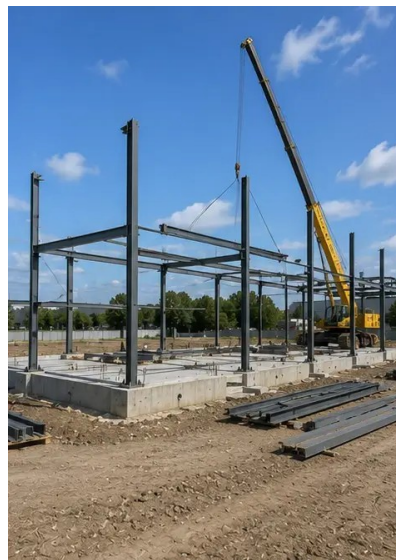
Foto št.6. Montaža nosilne konstrukcije začeta