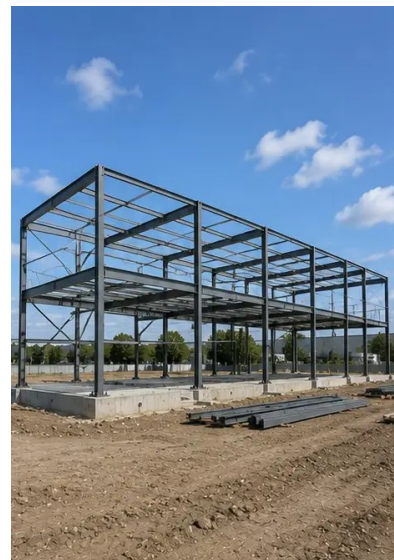
Foto št.7. Gradnja nosilne konstrukcije v teku