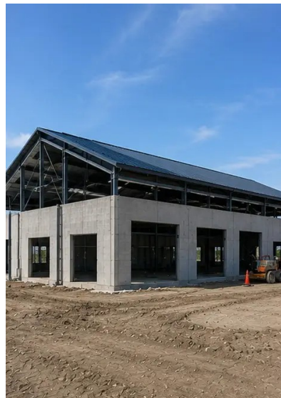
Foto št.10. Gradnja strehe končana