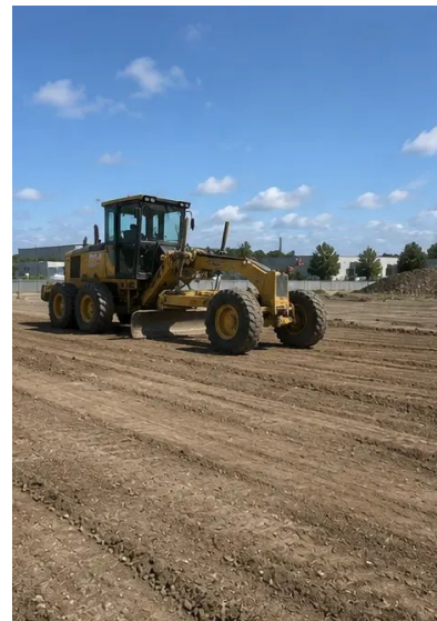
Foto št.3. Čiščenje in izravnava terena končana