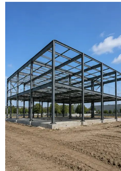
Foto št.8. Nosilna konstrukcija dokončana po projektnem terminskem planu