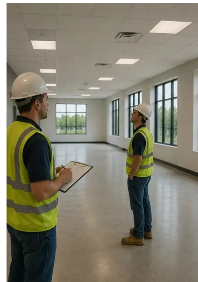
Foto št.15. Končni pregled projekta opravljen