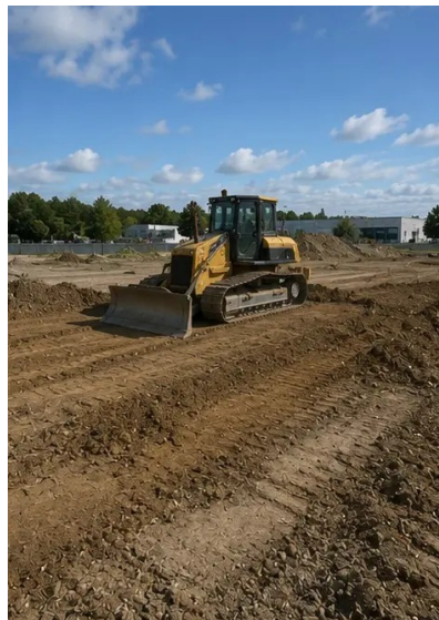
Foto št.2. Pripravljalne dejavnosti na gradbišču v teku