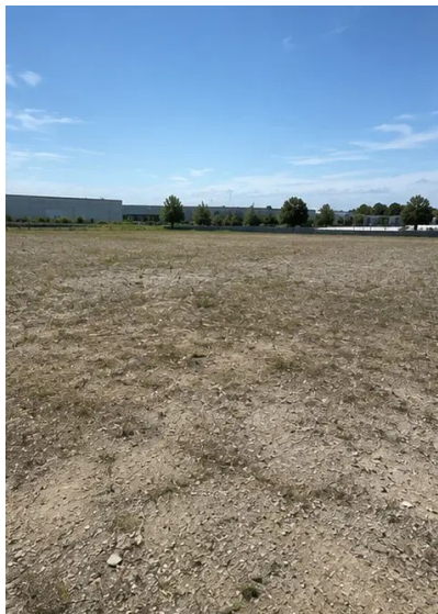
Foto št.1. Gradbišče pred začetkom del