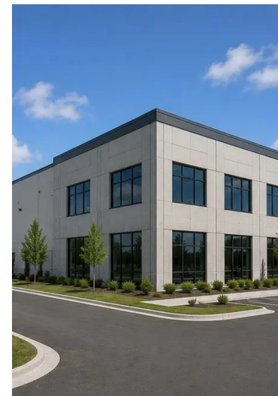
Foto št.16. Dokončan projekt pripravljen za obratovanje