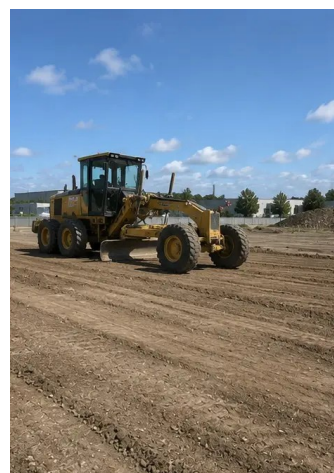
Foto št.4. Začetna izkopna dela zaključena