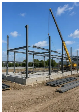
Foto št.7. Gradnja nosilne konstrukcije v teku