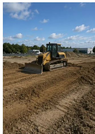
Foto št.3. Čiščenje in izravnava terena končana