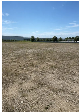
Foto št.2. Pripravljalne dejavnosti na gradbišču v teku