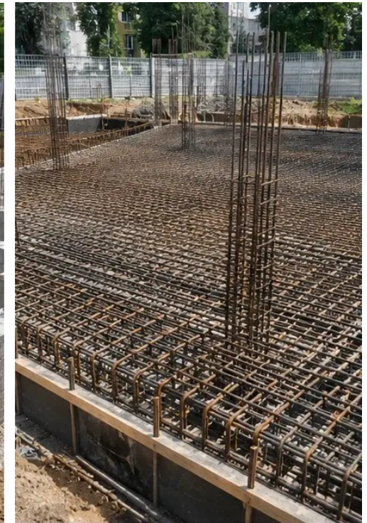
Fotografia č. 4 Inštalácia výstuže dokončená pred betonážou