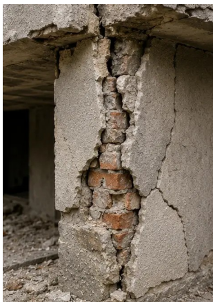
Photo #13. Detail konštrukčného poškodenia zdokumentovaný na posúdenie