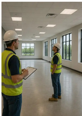
Fotografia č. 15. Záverečná kontrola projektu vykonaná