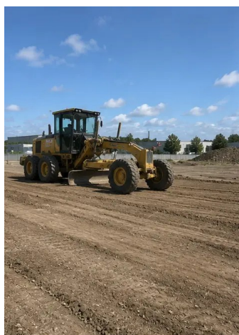
Fotografia č. 3. Vyčistenie a zarovnanie terénu dokončené