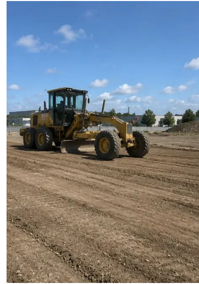
Fotografia č. 3. Vyčistenie a zarovnanie terénu dokončené