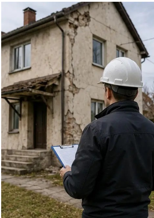
Фото №16 Итоговая фотография осмотра повреждений