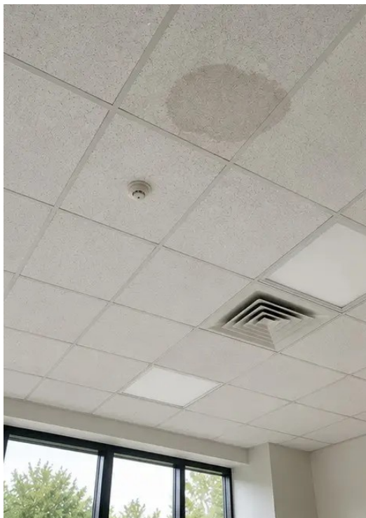
Фото №13 Состояние потолка задокументировано во время осмотра