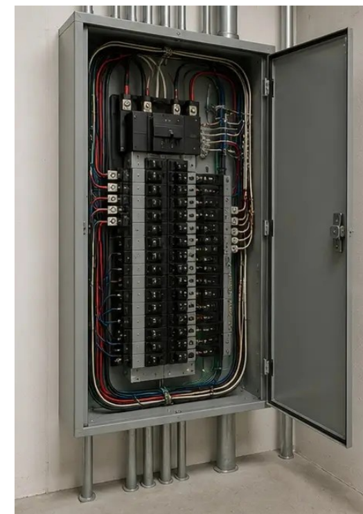
Фото №9 Состояние электрощита задокументировано