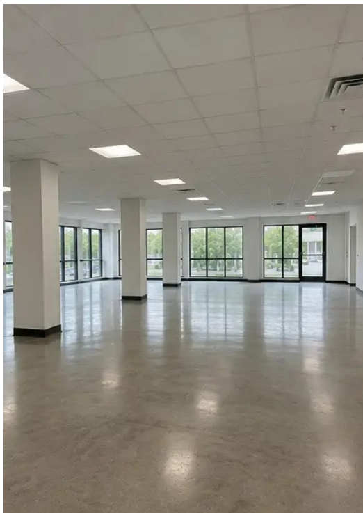
Фото №16 Итоговый обзор осмотренного объекта