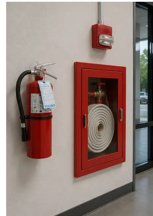
Фото №12 Средства безопасности осмотрены и зафиксированы