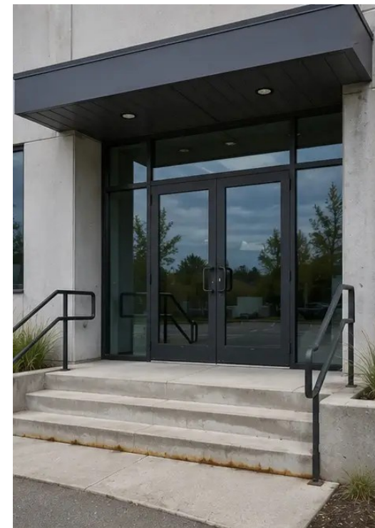
Фото №3 Зона главного входа осмотрена и задокументирована