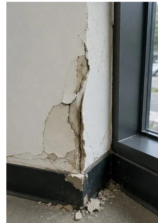
Фото №15 Выявленная дефектная зона задокументирована для дальнейшей оценки