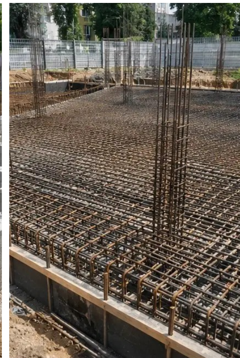
Foto nr.5 Operațiunea de betonare