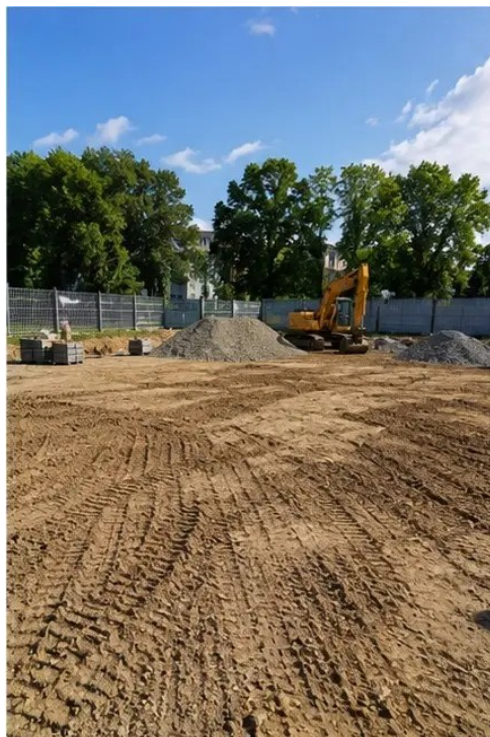
Foto nr.2 Săpături executate conform cerințelor proiectului