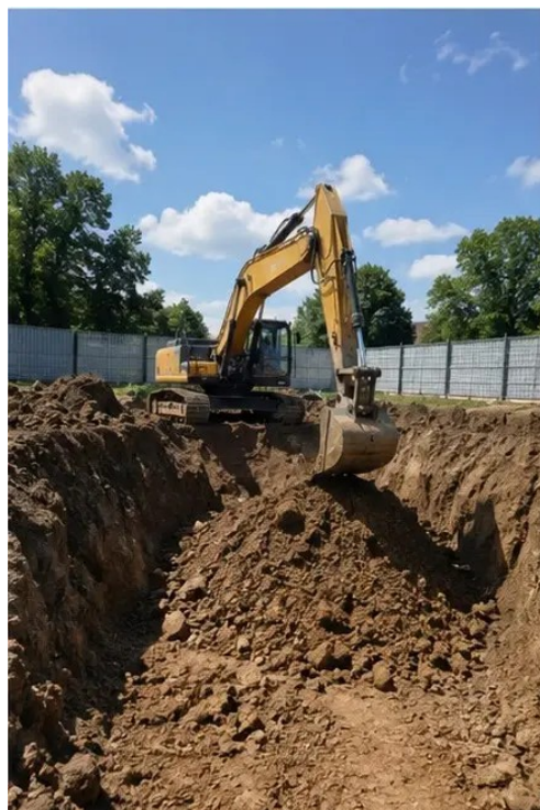
Foto nr.3 Construcția fundației în curs