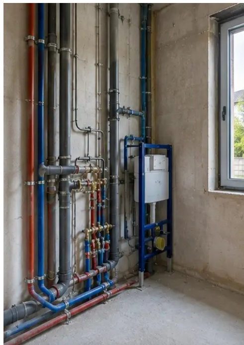
Foto nr.11 Lucrări de finisare a pereților interiori în curs