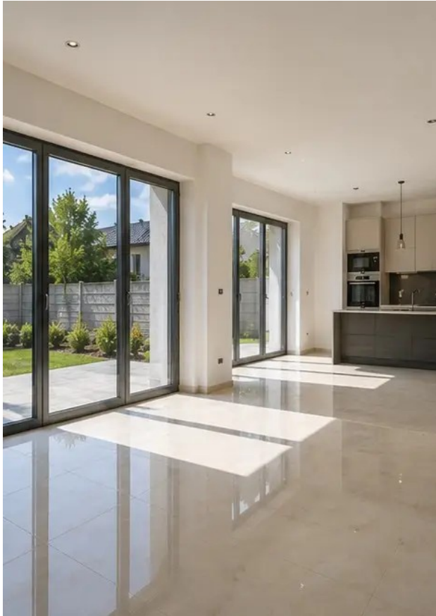
Foto nr.16 Interiorul clădirii finalizat pregătit pentru operare