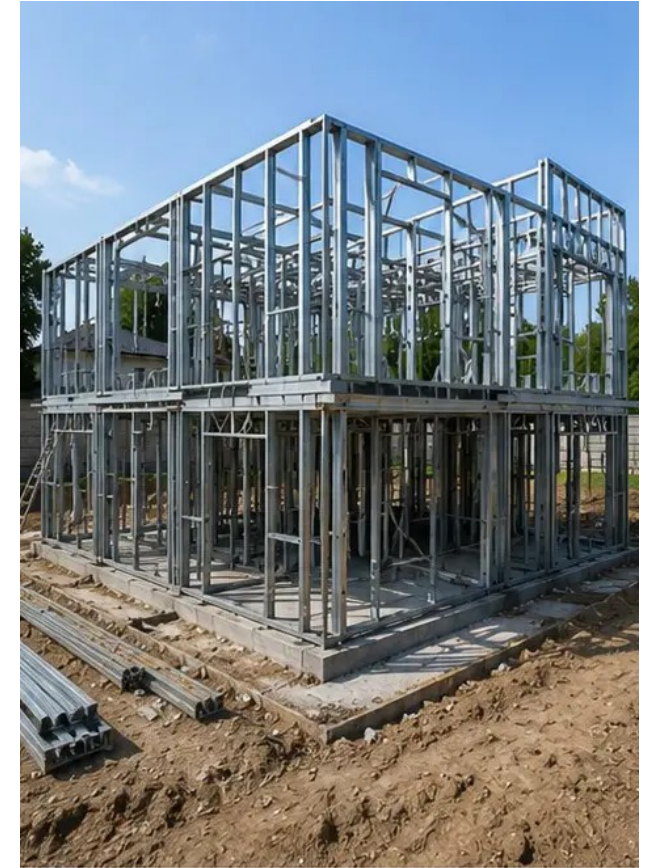
Foto nr.6 Asamblarea structurii de rezistență în curs