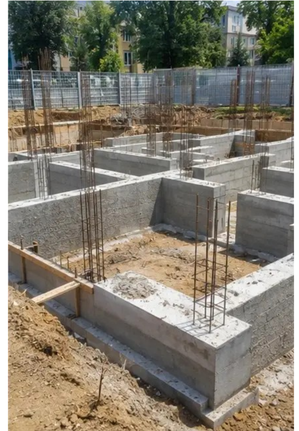
Foto nr.3 Construcția fundației în curs