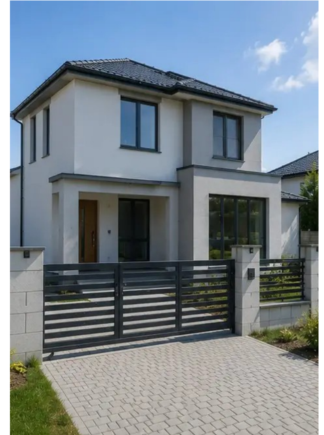
Foto nr.15 Exteriorul clădirii finalizat după construcție