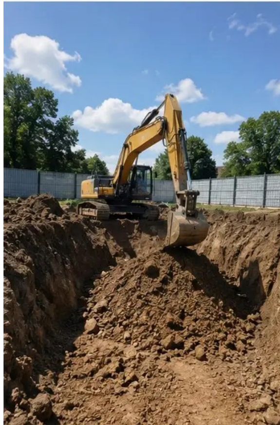
Foto nr.2 Săpături executate conform cerințelor proiectului