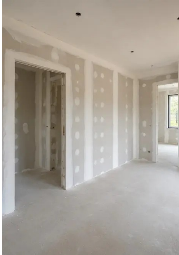
Foto nr.11 Lucrări de finisare a pereților interiori în curs