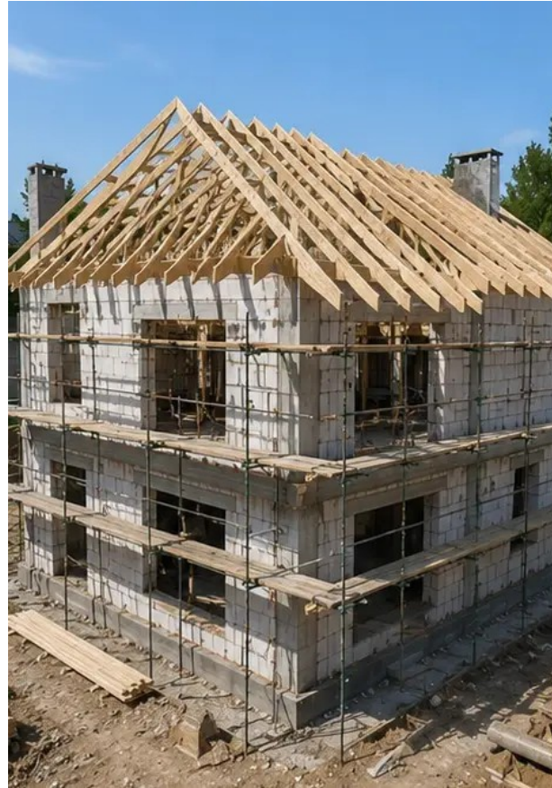
Foto nr.8 Lucrările de instalare a acoperișului finalizate