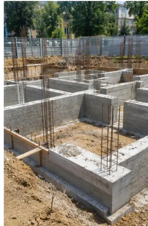
Foto nº4 Instalação das armaduras concluída antes da betonagem