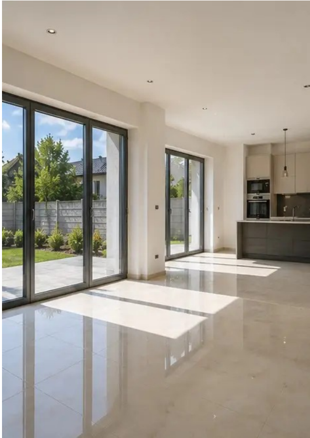
Foto nº16 Interior do edifício concluído pronto a funcionar