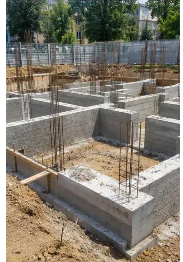
Foto nº3 Construção das fundações em andamento