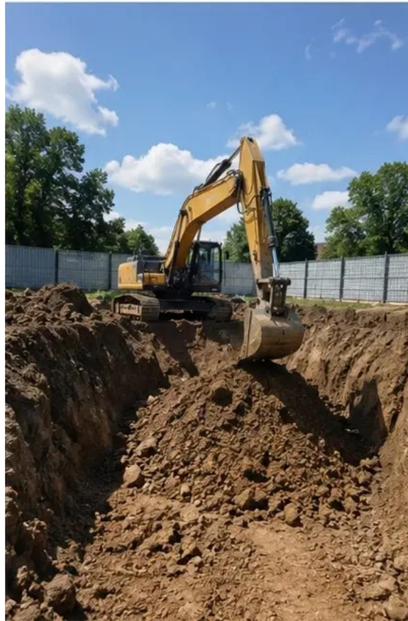
Foto nº2 Escavação executada de acordo com os requisitos do projeto