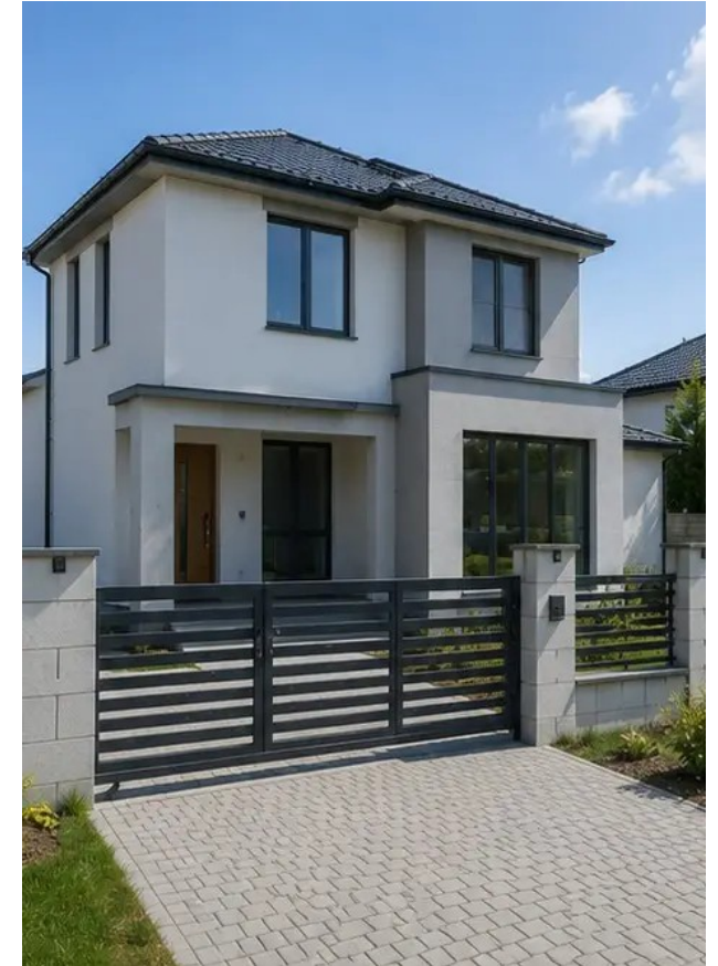
Foto nº15 Exterior do edifício concluído após a construção