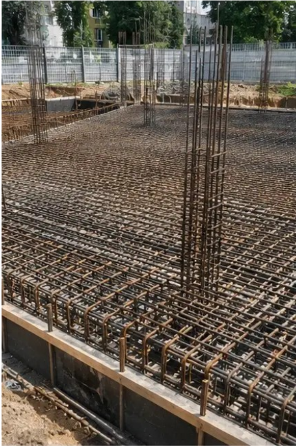
Foto nº4 Instalação das armaduras concluída antes da betonagem