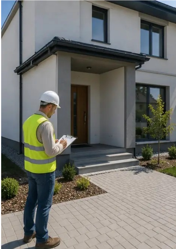
Foto nº13 Inspeção final dos trabalhos de construção concluídos