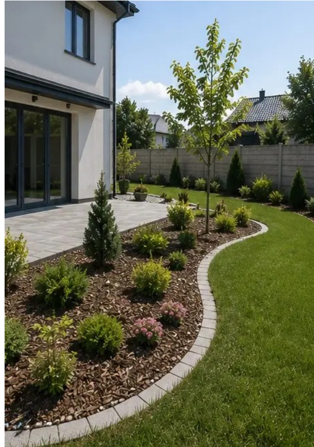
Foto nº14 Arranjos exteriores concluídos em redor da instalação