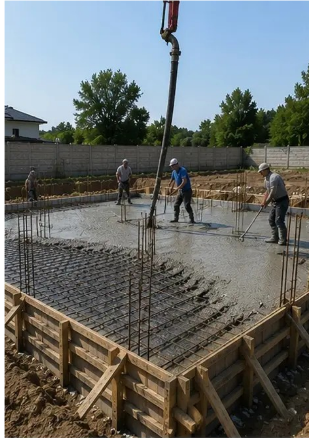
Foto nº5 Betão aplicado nos elementos de fundação