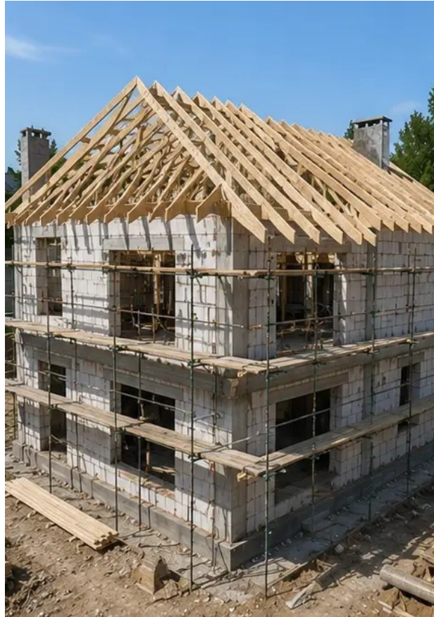
Foto nº8 Instalação da cobertura concluída