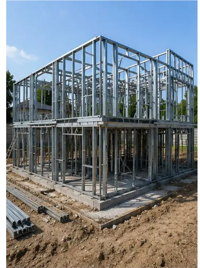
Foto nº6 Montagem da estrutura portante em andamento