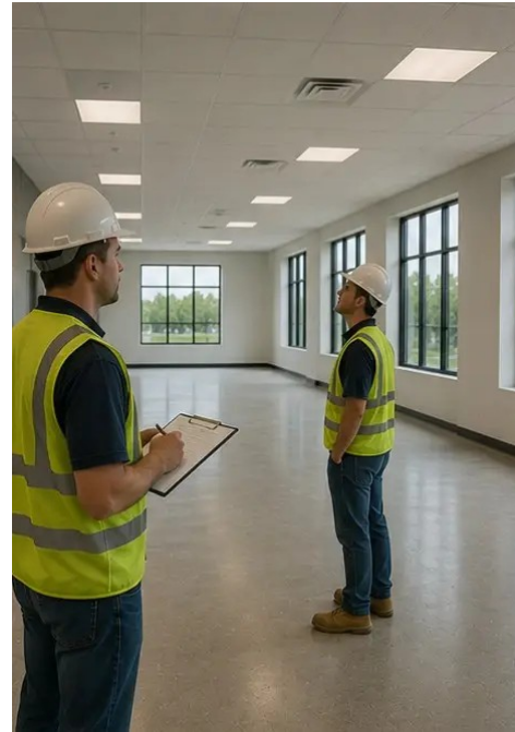
Foto nº15. Inspeção final do projeto realizada