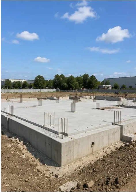
Foto nº5. Construção das fundações concluída