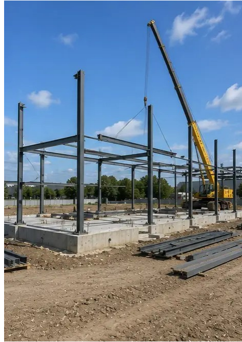
Foto nº6. Montagem da estrutura portante iniciada