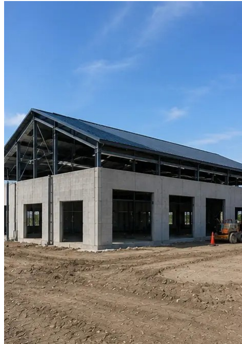
Foto nº10. Construção da cobertura concluída