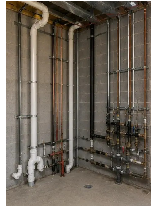
Foto nº12. Instalação dos sistemas hidráulicos concluída