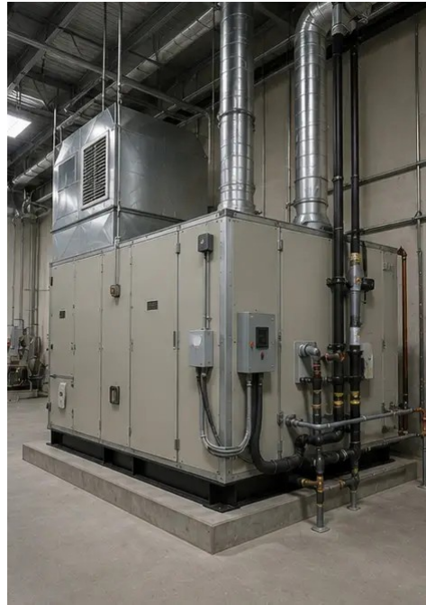
Foto nº14. Instalação de equipamentos concluída