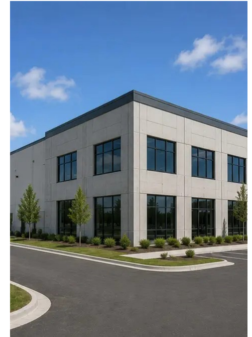
Foto nº16. Projeto concluído pronto a funcionar