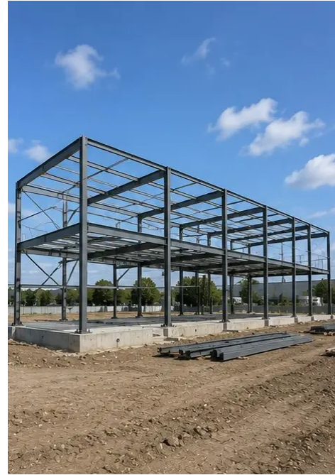
Foto nº7. Construção da estrutura portante em andamento