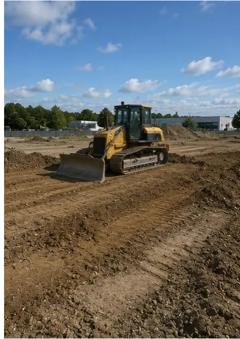
Foto nº2. Atividades de preparação do local em andamento