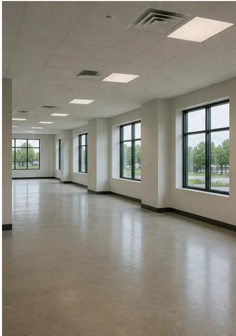
Foto nº13. Trabalhos de acabamento interior em andamento