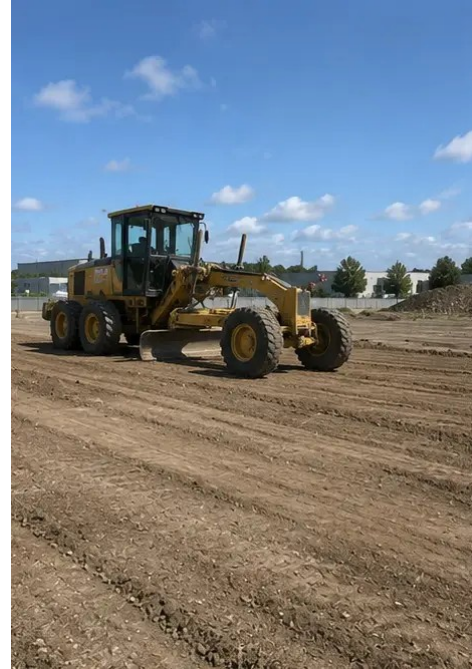
Foto nº3. Limpeza e nivelamento do terreno concluídos