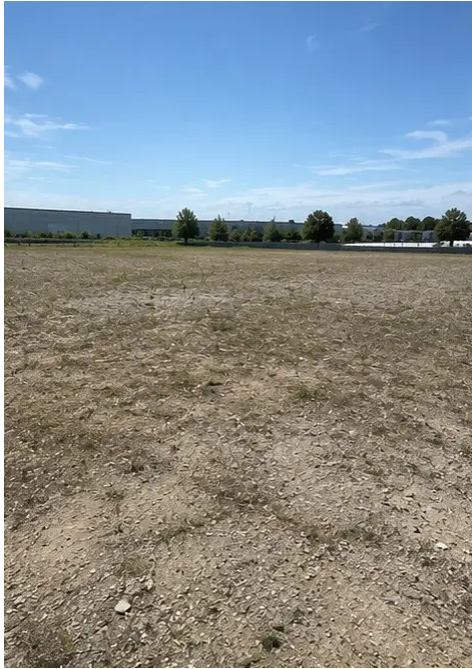
Foto nº1. Local do projeto antes do início dos trabalhos