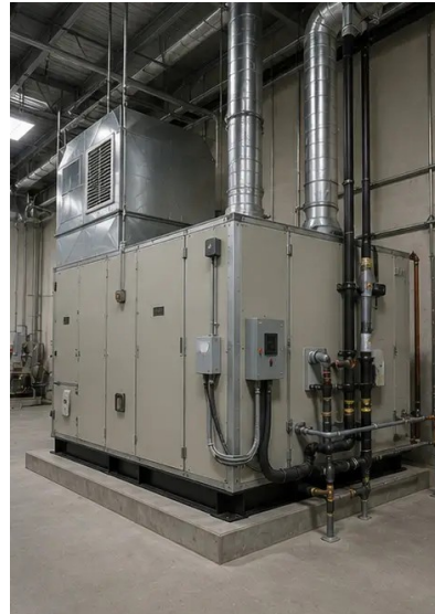
Foto nº14. Instalação de equipamentos concluída