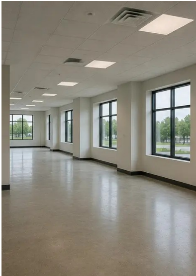
Foto nº13. Trabalhos de acabamento interior em andamento