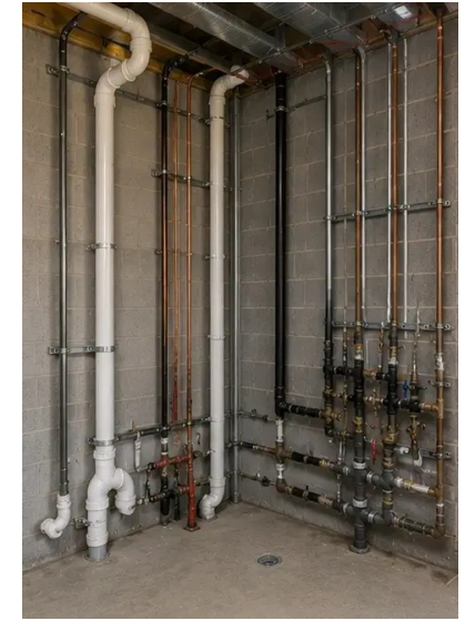
Foto nº12. Instalação dos sistemas hidráulicos concluída