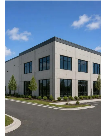
Foto nº16. Projeto concluído pronto a funcionar