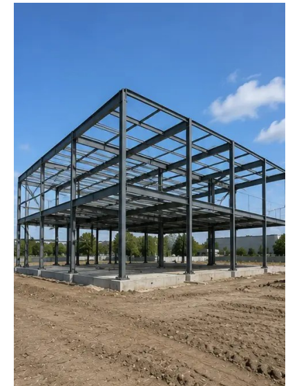
Foto n°8. Estrutura portante concluída de acordo com o cronograma do projeto