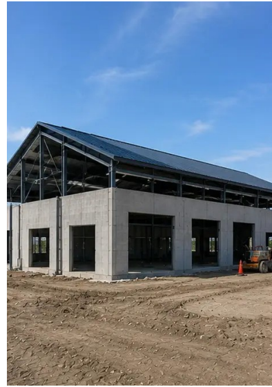
Foto nº10. Construção da cobertura concluída