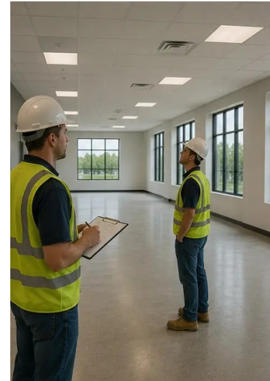
Foto nº15. Inspeção final do projeto realizada