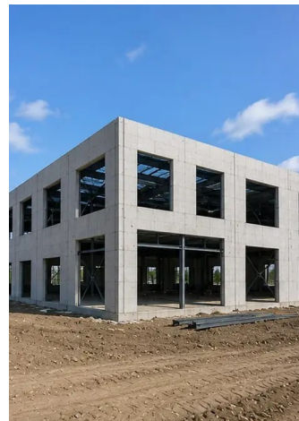
Foto nº10. Construção da cobertura concluída