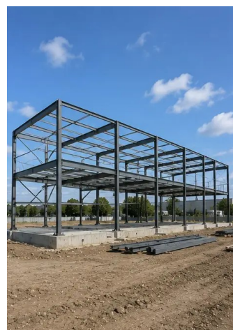
Foto nº8. Estrutura portante concluída de acordo com o cronograma do projeto