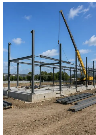
Foto nº7. Construção da estrutura portante em andamento