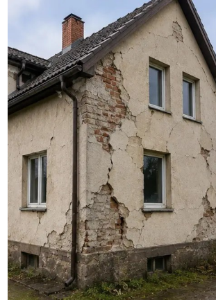
Photo #2. Resumo dos danos exteriores documentados durante a inspeção