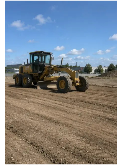
Dokumentacja fotograficzna №3. Oczyszczenie i wyrównanie terenu zakończone