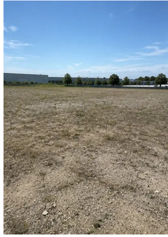
Dokumentacja fotograficzna №1. Teren budowy przed rozpoczęciem prac