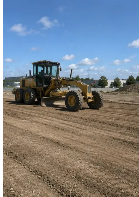
Dokumentacja fotograficzna №3. Oczyszczenie i wyrównanie terenu zakończone